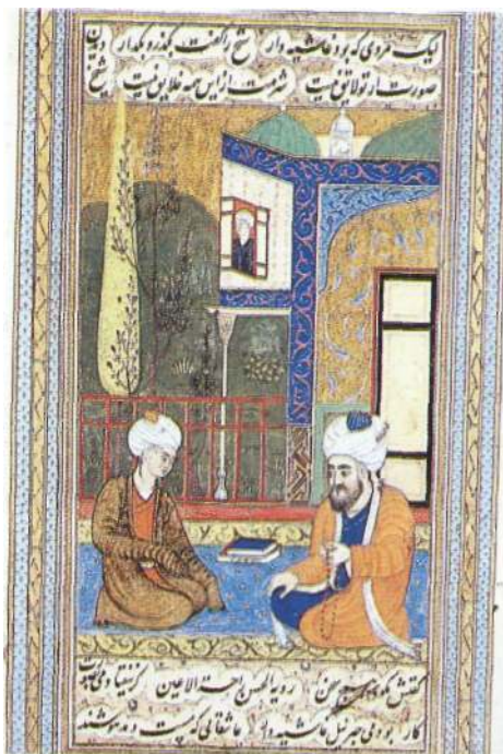
Y. P. Fig. 1 : Ghazzâli, signé Farhad ( Majâles al-'oshshâq , manuscrit dispersé, ancienne coll. Pozzi). p. 269.