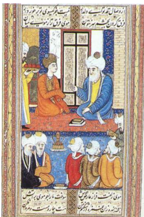
Y. P. Fig. 2 : Abu Yazid Bastâmi, signé Farhad ( Majâles al-'oshshâq , manuscrit dispersé, ancienne coll. Pozzi). p. 269, 270.