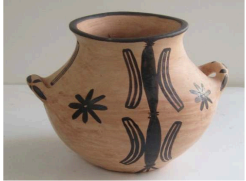
(الصورة 4) تاگمبورث: نفس الفضاء 2010