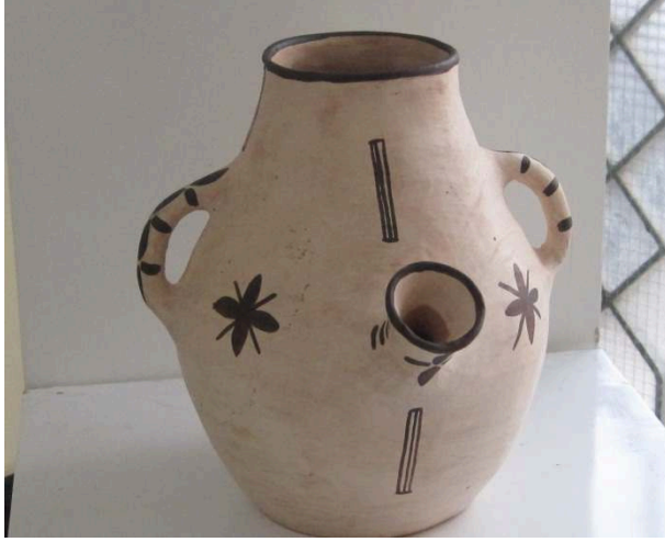
(الصورة 3) اقشورور: الفضاء التابع لمندوبية الصناعة التقليدية بمدينة الحسيمة 2010