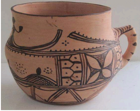
(الصورة 5) اغاراف: نفس الفضاء 2010