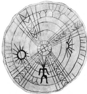
Fig. 3. Tambour ket. Musée d'anthropologie et d'ethnographie de Saint-Petersbourg, n° 4034-151 (Oppitz, 2007, 69, aquarelle de Freda Heyden).

Les motifs graphiques de l'art profane se retrouvent sur les objets chamaniques, mais intégrés à un schéma orienté, comme on le devine déjà sur les ornements des linteaux de porte. Costume et tambour rituels portés par le chamane établissent un lien entre le graphisme profane et la perception du corps dans ses rapports au monde.