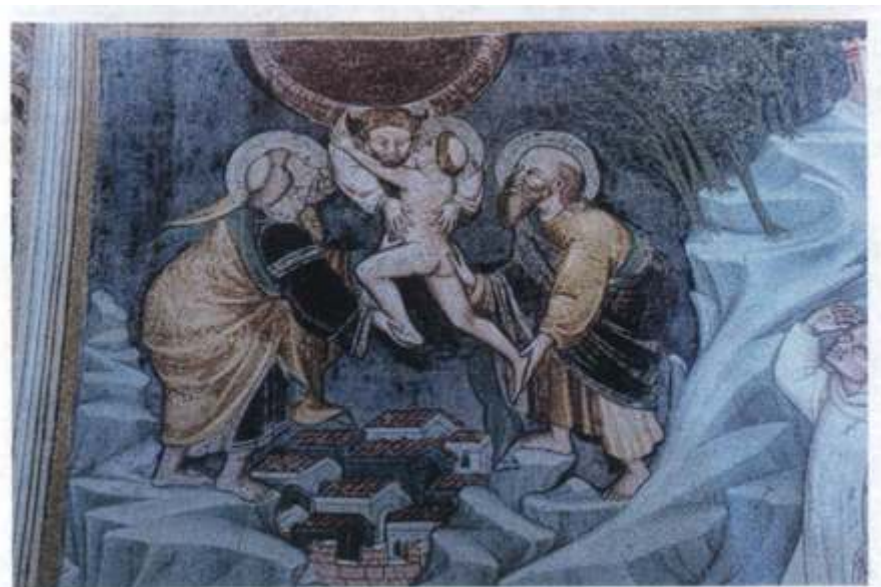
L'âme sainte de Thomas d'Aquin élevée jusqu'au ciel par saint Pierre et saint Paul (fresques de l'église Santa Maria in Piano à Loreto Aprutino, Abruzzes, vers 1420).