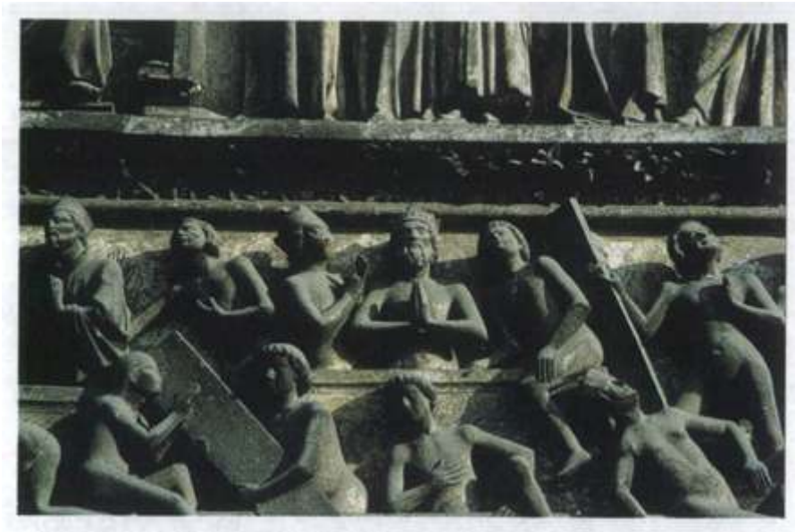
La résurrection des corps lors du Jugement dernier (Cathédrale de Bourges, portail central, vers 1240).