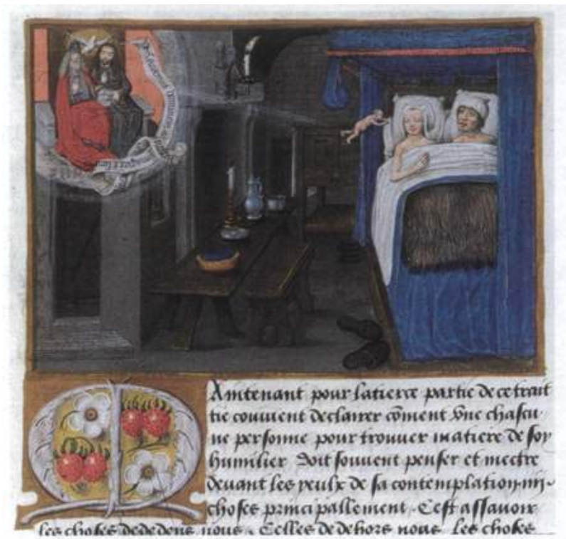
Les parents, la Trinité et l'infusion de l'âme lors de la conception de l'enfant (Paris, Bibliothèque de l'Arsenal, ms. 5206, fol. 174, vers 1490).