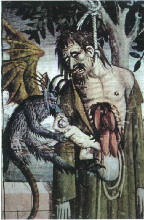
L'âme traîtresse de Judas sortant de son ventre ouvert (fresque peinte par G. Canavesio, Notre-Dame des Fontaines à La Brigue, Alpes-Maritimes, fin du XV e siècle).