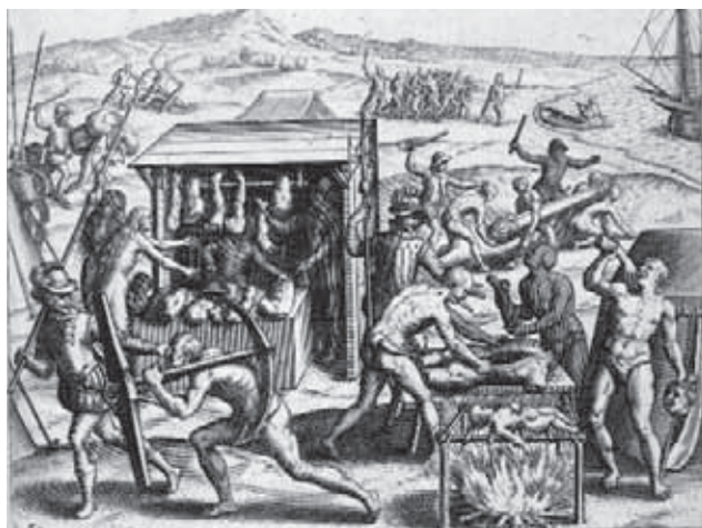
La boucherie de chair humaine

Après 1596, date de la parution du sixième volume, de Bry interrompt temporairement son œuvre, alors qu'il a mis en images, en trois tomes, l'ouvrage de Benzoni traduit par Chauveton 42 . A-t-il atteint l'objectif qu'il s'était fixé ? Ce n'est pas certain. La goutte le fatigue-t-elle ? Probablement, mais il n'interrompt pas la gravure et, en 1598, année de sa mort, sort des presses un ouvrage qui crée en Europe un profond sentiment de malaise : Narratio regionum Indicarum per Hispanos quosdam devastatarum verissima 43 . Cet ouvrage provient d'une double origine : d'abord, il s'appuie sur l' Historia de las Indias rédigée à partir de 1527 44 par Bartolomé de Las Casas et publiée en 1552 (Milhou, 1995 : 7) ; sa seconde source est la traduction de l'œuvre précédente du castillan en latin par le protestant flamand Jacques de Migrode 45 , éditée en 1579. Ce dernier