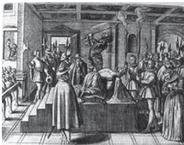
Exécution de Marie Stuart [Lestringant, Richard Verstegan : Le théâtre des cruautés (1587), Paris, Chandeigne, 1995, p. 141]

Un ensemble de vingt-neuf images permet de frapper l'imaginaire des lecteurs, tant par la finesse de l'exécution des planches, qui met en évidence des détails sordides, que par une représentation explicite et choquante pour l'époque, chacune étant accompagnée d'un texte d'autant plus précis dans la narration de l'horreur. Les illustrations concernant l'Angleterre peuvent être perçues comme une revanche pour l'auteur qui a dû fuir ce pays 34 . Une planche, par exemple,