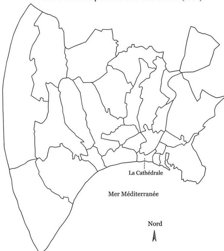
Carte n°1bis. Les paroisses de la ville de Nice (1954)

Les cartes (numérisées par nos soins) représentent les limites des paroisses du diocèse de Nice en 1954, telles que présentées dans le fascicule réalisé par le diocèse de Nice en 1959 (Diocèse de Nice, 1959) et intitulé La pratique dominicale . Les entités paroissiales sont alors au nombre de 243, dont 26 dans la ville de Nice. Ces cartes, même si elles sous-estiment de 20 entités le nombre de paroisses recensées en 1999 (suite à un déploiement de paroisses urbaines dans les années 1960-1980, en particulier), illustrent bien le morcellement territorial qui prévalait avec le redécoupage, spécialement dans la partie nord du diocèse (« zone rurale »), faiblement peuplée. Selon les auteurs de ce rapport, les paroisses rurales sont au nombre de 139 et rassemblent 5,2 % de la population du diocèse (Diocèse de Nice, 1959 : 31).