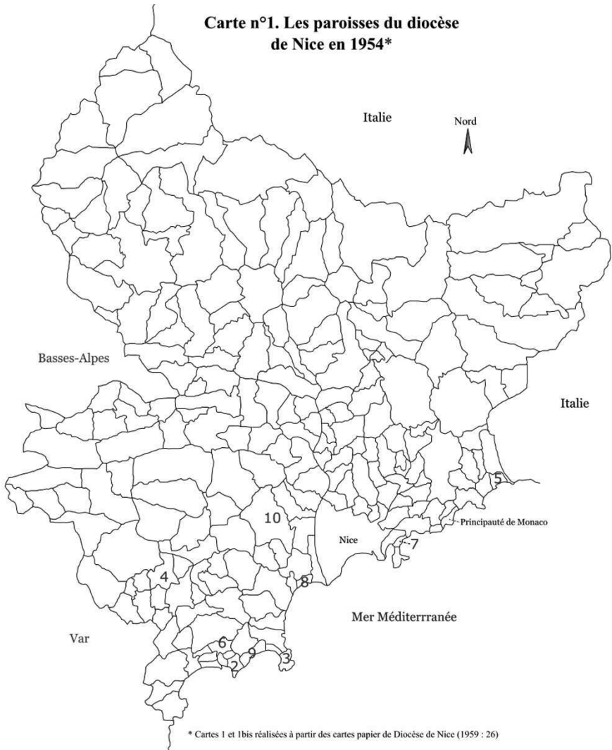
Carte n°1. Les paroisses du diocèse de Nice en 1954*