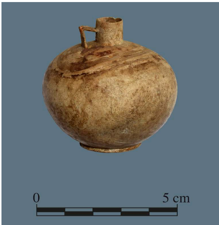
Fig. 3. Aryballe, ivoire, de Pompéi I 16, 3, inv. 11879.