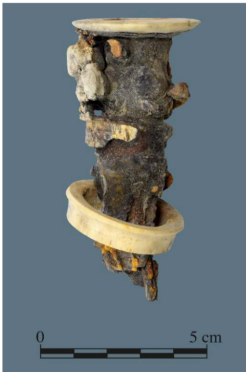
Fig. 1. Fragment de montant de lit, os, bois et métal, de Pompéi I 16, 3, inv. 1200I.