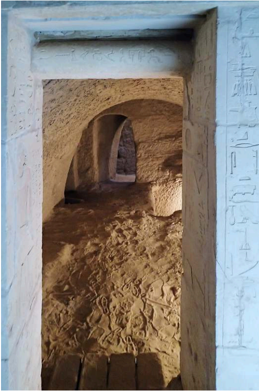
Fig. 2. Complexe funéraire TG 3 : façade décorée de la chapelle funéraire T11 du prêtre ritualiste Intef ; vue de l'est vers l'ouest (V. Dobrev).