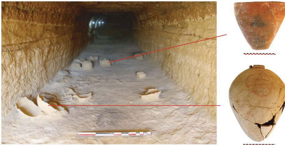
Fig. 2. Céramiques dans la galerie G26 (Mission archéologique du Ouadi el-Jarf).