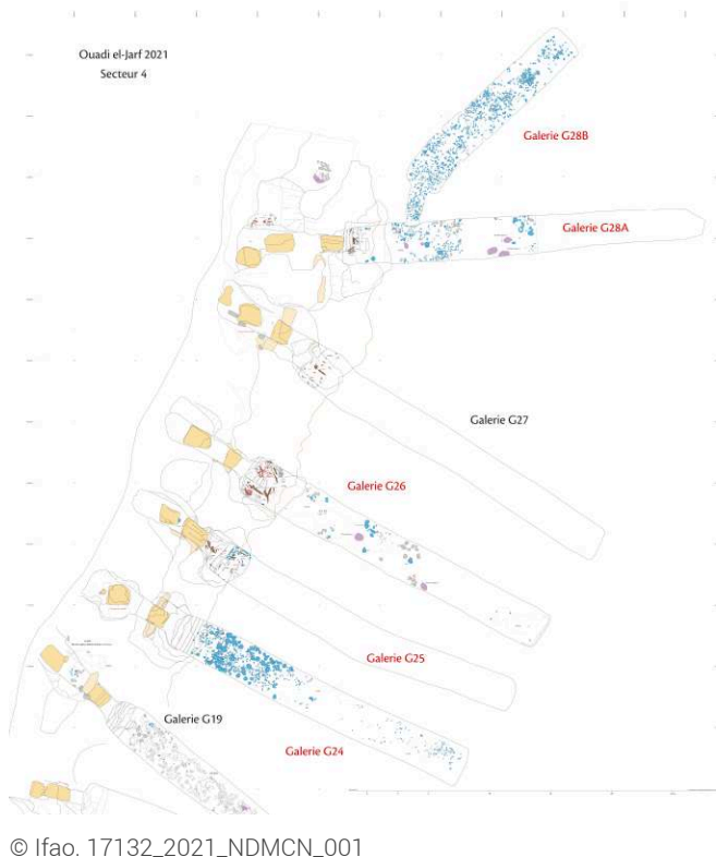
Fig. 1. Ensemble des galeries du deuxième système de magasin, état de la fouille en avril 2021.