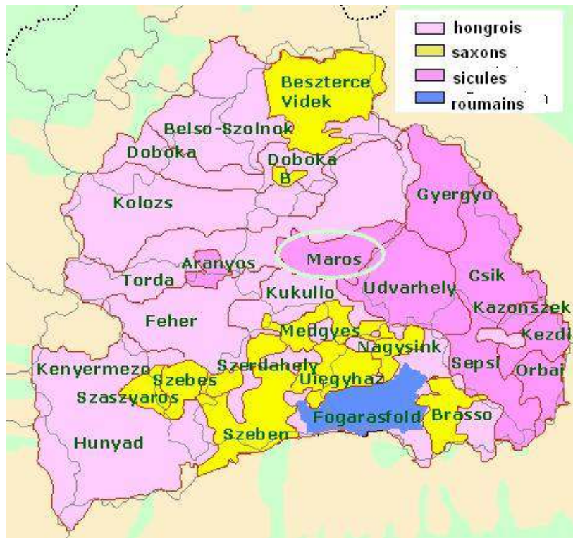
Figure 3. Principauté de Transylvanie sous le règne des « trois nations » (XIV e -XVIII e siècle) et Siège de Mureș (Maros)