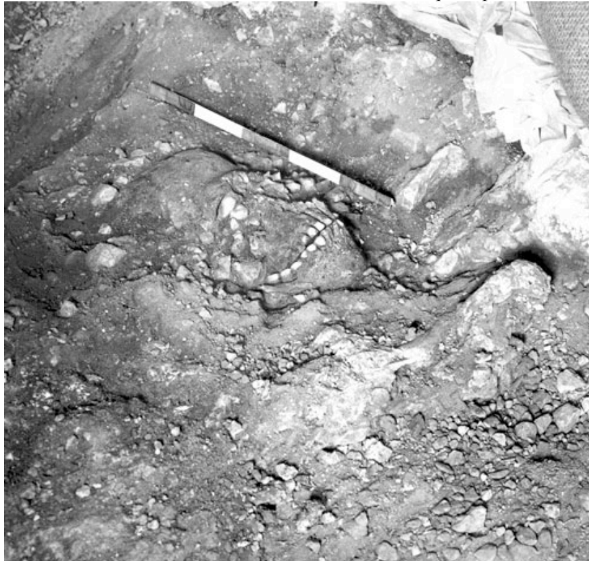
Figure 2 : Le crâne de Qafzeh 7 en cours de dégagement au cours de la campagne de fouilles de 1934.

première année a porté sur l'intérieur de la cavité où fut mise en évidence une importante stratigraphie du Paléolithique supérieur et moyen. Un frontal humain a été exhumé d'une couche remaniée. La partie antérieure d'une calotte crânienne et deux fragments de mandibule furent « trouvés in situ dans une couche du Paléolithique supérieur ».