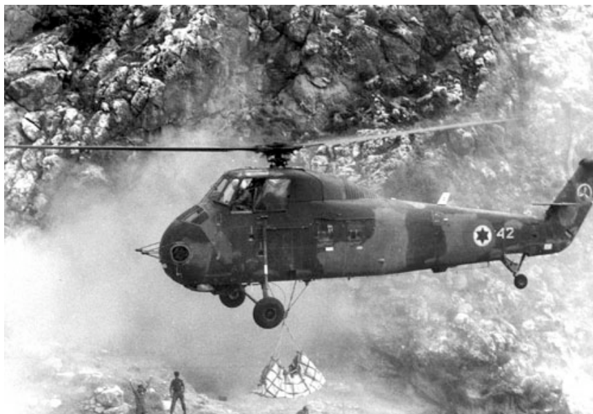
Figure 3 : Enlèvement par hélicoptère du squelette Qafzeh 9 en septembre 1967.

Toutefois, à la demande de la municipalité de Nazareth nous avons entrepris, toujours avec O. Bar-Yosef, la remise en état du gisement en 1996 et 1997. La ville avait le projet d'aménager le gisement et de construire un musée de site. Nous avons profité de cette opération pour étoffer un peu les séries lithiques du Paléolithique supérieur, dont certaines étaient trop réduites pour permettre une identification incontestable des cultures. Au cours de ces travaux nous avons aussi tamisé des sédiments provenant d'un petit effondrement de la partie sud-est de la fouille. Ils renfermaient un fragment de mandibule d'enfant avec une molaire déciduale et la couronne d'une canine adulte. L'origine de ces pièces a pu être établie avec une bonne précision du fait de la faible importance de l'éboulement, de la nature des sédiments et de l'aspect des os. Ils proviennent des niveaux de base, c'est-à-dire des couches XIX à XXI. Malheureusement le projet d'aménagement n'a pas encore pu se concrétiser et nous avons recouvert les coupes.