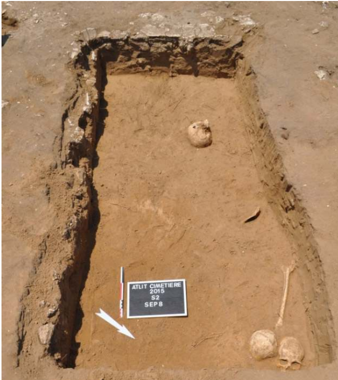
Quelques exemples de tombes fouillées sur le site : tombe S2SP8 en cours de fouille