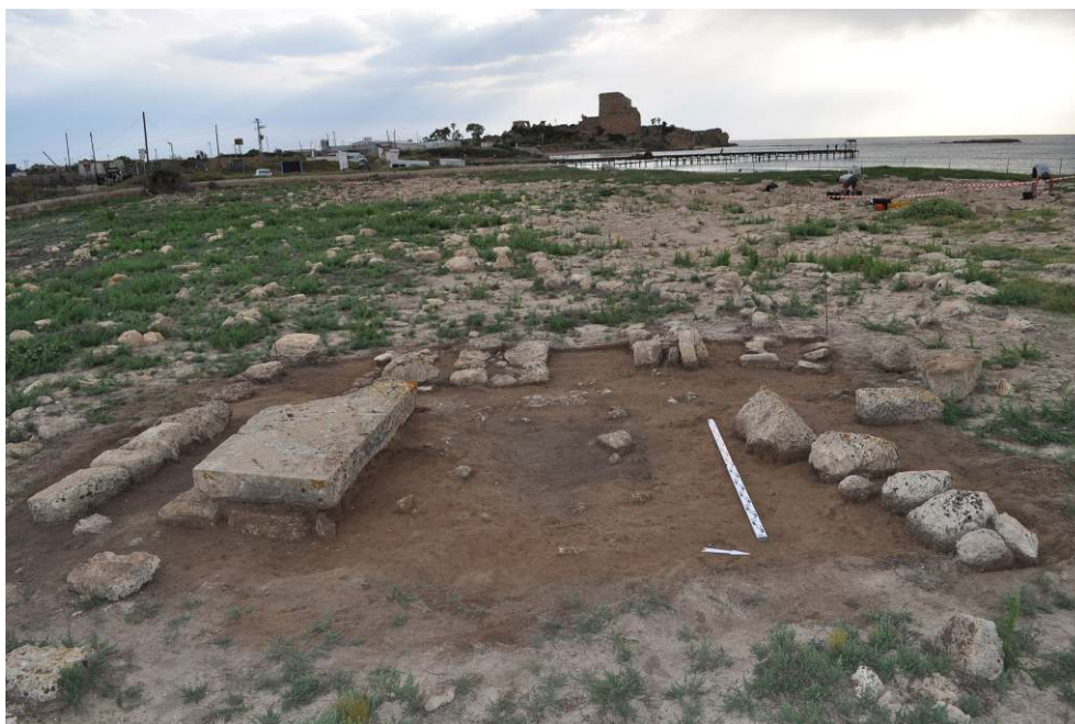
Vue du cimetière d'Atlit (secteur 2 de la fouille 2015) avec le Château-Pèlerin en arrière-plan