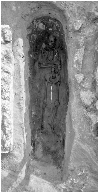
Quelques exemples de tombes fouillées sur le site : tombe en fosse S1SP8