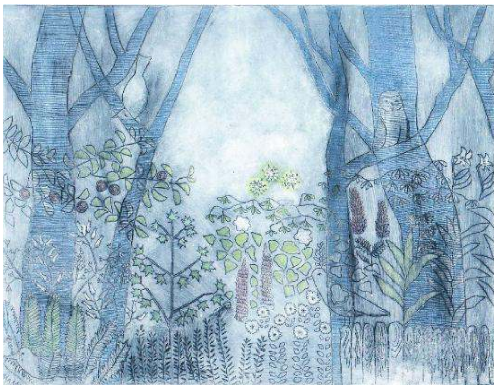
Figure 2. « Spreewald. Eau forte ».