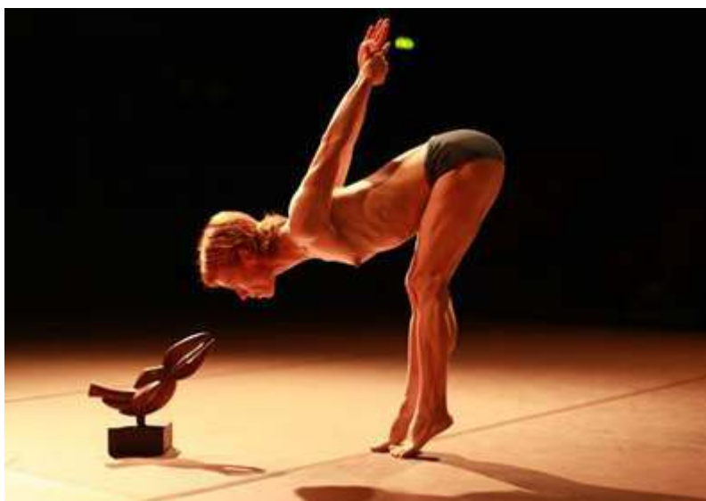
Photographie d'Antoine Conjard, source : Lanabel, 2015.