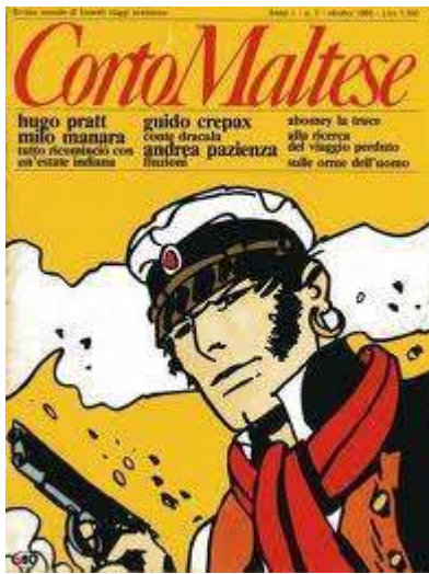
Corto Maltese, n.1