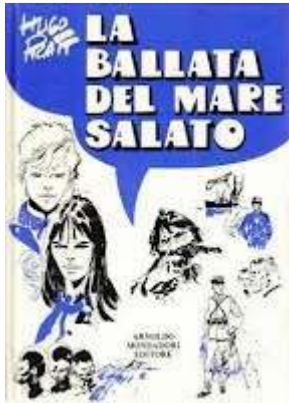
La ballata del mare salato