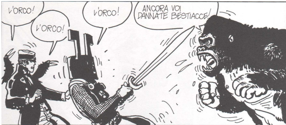
Le elvetiche – Rosa alchemica