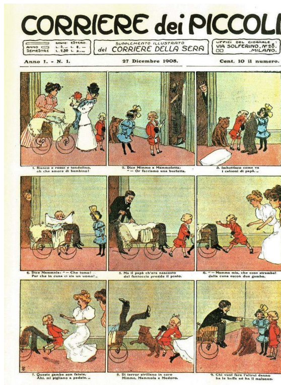
Il Corriere dei Piccoli, n.1