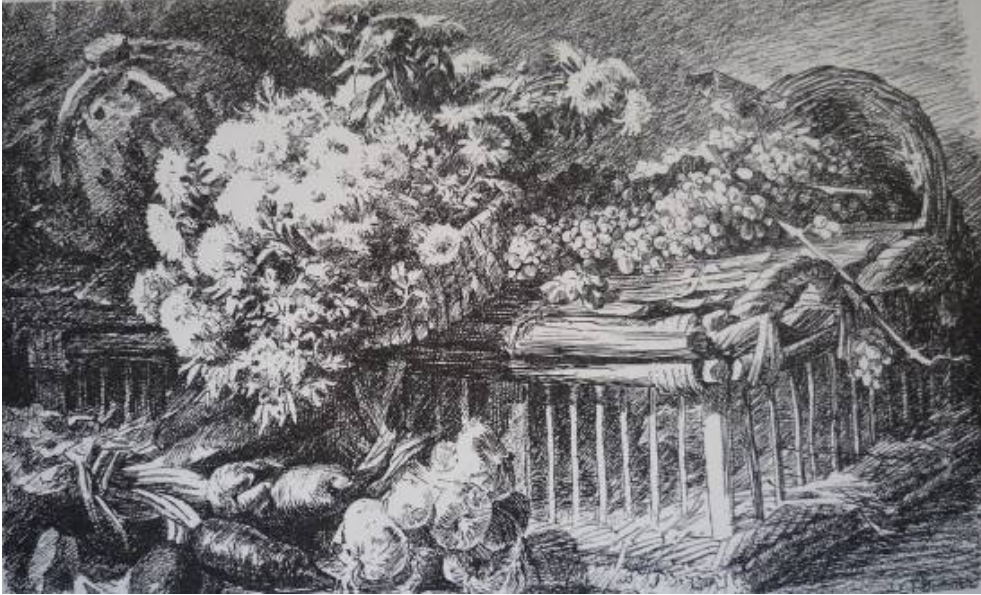
Gravure d'après Retour de la halle de Gabriel Thurner, L'Exposition des Beaux-arts , Paris, Ludovic Baschet, 1880, 14 e livraison, non paginé.