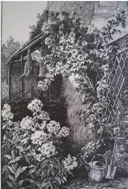
Gravure d'après Un Coin de mon jardin d'Henri Biva, L'Exposition des Beaux-arts , Paris, Ludovic Baschet, 1880, 14 e livraison, non paginé.