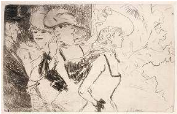
Jean-Louis Forain, « Les Folies-Bergère », eau-forte reproduite hors-texte, dans Joris-Karl Huysmans, Croquis parisiens , Paris, Vaton, 1880.