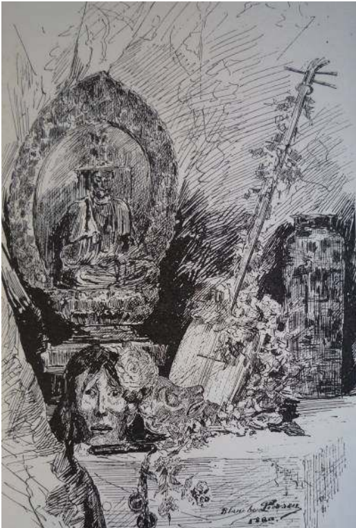
Gravure d'après Accessoires de la danse sacrée, au Japon de Blanche Pierson, L'Exposition des Beaux-arts , Paris, Ludovic Baschet, 1880, 14 e livraison, non paginé.