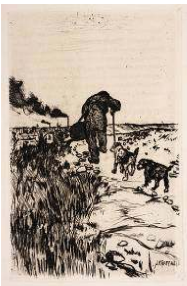
Jean-François Raffaëlli, « Vue des remparts du Nord-Paris », eau-forte reproduite hors-texte, dans Joris-Karl Huysmans, Croquis parisiens , Paris, Vaton, 1880.