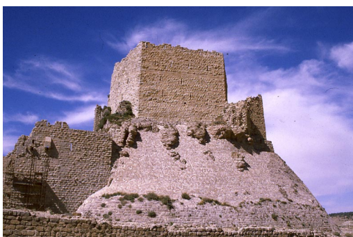
Fig. 4 : Forteresse de Kérak

La construction de Kérak (Fig. 4), interviendra tardivement pour des raisons précises, liées non pas à un problème de défense mais de sécurité intérieure. Cette construction eut lieu