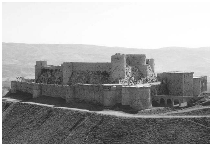
Fig. 9 : Krak des Chevaliers. Vue générale depuis le sud-ouest (à droite au premier plan, front sud avec les tours monumentales)

programme de fortification ex nihilo , mais durent adapter leurs travaux aux fortifications préexistantes. En effet, les sultans ne pouvaient se risquer à démanteler ces ouvrages défensifs ayyoubides et croisés pour symboliser la chute de leurs constructeurs, ce qui aurait constitué une grave erreur militaire et politique comme le soulignèrent fréquemment les chroniqueurs de l'époque, notamment après le démantèlement du château de Šawbak en 1293 14 .