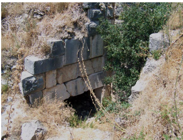
Fig. 7 : Château d'al-Šuġūr-Bakās. Entrée coudée ayyoubide sur le front ouest.

Saladin en 1188 et confiée en iqṭā' à l'émir Ġars al-Dīn Qiliġ au sein du territoire de la principauté d'Alep, la position fortifiée fut mise sous contrôle en 1198 par le prince al-Zāhir Ġāzī après la révolte des descendants de l'émir 7 . Le prince d'Alep lança alors immédiatement sur le site un programme de fortification d'une ampleur considérable répondant à des préoccupations militaires du fait de la proximité d'Antioche, mais également à des ambitions politiques. En effet, la conquête du château par le prince d'Alep et sa transformation en une puissante forteresse symbolisaient l'implantation de l'autorité du prince dans une région demeurée jusque là dans une situation de semi-autonomie, voire de rébellion encouragée par la distribution des iqṭā' sous le règne de Saladin. La présence de six voire sept mentions épigraphiques sur le site confirme son statut de vitrine pour le pouvoir du prince ayyoubide d'Alep : ces inscriptions aux textes similaires glorifiant al-Zāhir Ġāzī pour la mise en défense du site furent disposées aux niveaux des accès les plus fréquentés du château 8 .