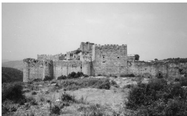
Fig. 3 : Château de Saladin, Ṣahyūn. Vue générale du front est.

Ce fut ainsi le cas de l' iqṭā' des émirs Mengüverish, situé dans le nord de la Syrie côtière, où le pouvoir était exercé de manière quasi autonome par rapport à la principauté d'Alep à laquelle était en principe rattaché le territoire. Les émirs qui se succédèrent à la tête de l' iqṭā' après son octroi par Saladin en 1188 régnèrent durant plus de 80 ans 5 . Cette pérennité de l' iqṭā' est d'autant plus remarquable que le territoire avait été fraîchement conquis sur la