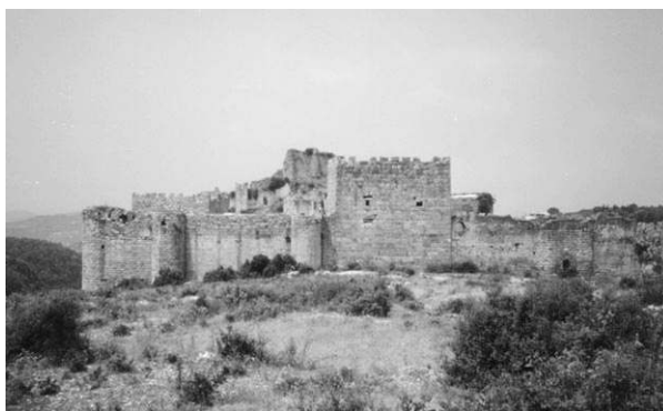
Fig. 3 : Château de Saladin, Ṣahyūn. Vue générale du front est.

Ce fut ainsi le cas de l' iqṭā' des émirs Mengüverish, situé dans le nord de la Syrie côtière, où le pouvoir était exercé de manière quasi autonome par rapport à la principauté d'Alep à laquelle était en principe rattaché le territoire. Les émirs qui se succédèrent à la tête de l' iqṭā' après son octroi par Saladin en 1188 régnèrent durant plus de 80 ans 5 . Cette pérennité de l' iqṭā' est d'autant plus remarquable que le territoire avait été fraîchement conquis sur la