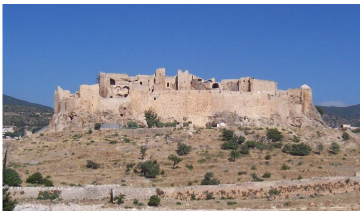
Fig. 8 : Citadelle de Maşyāf. Vue générale depuis l'est.

Enfin, le territoire des Isma'iliens, enclave chiite constituée au milieu du XII e siècle au cœur de la chaîne montagneuse syrienne, en bordure de la principauté d'Alep sunnite et des États latins, parvint à maintenir ses frontières à cette époque par la mise en œuvre de programmes de fortification « locaux » sur les châteaux principaux parmi lesquels Maşyāf jouait le rôle de capitale (fig. 8) 11 .