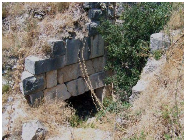
Fig. 7 : Château d'al-Šuġūr-Bakās. Entrée coudée ayyoubide sur le front ouest.

Saladin en 1188 et confiée en iqṭā' à l'émir Ġars al-Dīn Qiliġ au sein du territoire de la principauté d'Alep, la position fortifiée fut mise sous contrôle en 1198 par le prince al-Zāhir Ġāzī après la révolte des descendants de l'émir 7 . Le prince d'Alep lança alors immédiatement sur le site un programme de fortification d'une ampleur considérable répondant à des préoccupations militaires du fait de la proximité d'Antioche, mais également à des ambitions politiques. En effet, la conquête du château par le prince d'Alep et sa transformation en une puissante forteresse symbolisaient l'implantation de l'autorité du prince dans une région demeurée jusque là dans une situation de semi-autonomie, voire de rébellion encouragée par la distribution des iqṭā' sous le règne de Saladin. La présence de six voire sept mentions épigraphiques sur le site confirme son statut de vitrine pour le pouvoir du prince ayyoubide d'Alep : ces inscriptions aux textes similaires glorifiant al-Zāhir Ġāzī pour la mise en défense du site furent disposées aux niveaux des accès les plus fréquentés du château 8 .