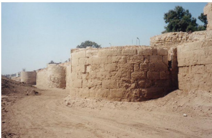
Fig. 2 : Muraille ayyoubide du Caire. Segment nord-est de la muraille avec des tours de flanquement semi-circulaires.

En revanche, le grand programme de fortification du Caire dont il ordonna la mise en œuvre moins de deux ans après la mort de Nūr al-Dīn, durant l'année 1176, procéda en grande partie d'une volonté de Saladin d'affirmer son indépendance vis-à-vis d'un pouvoir nūride à l'agonie dans le Bilād al-Šām, mais répondit également du souci d'enterrer définitivement le pouvoir fatimide en Égypte dont il avait progressivement sapé les bases depuis son accession au vizirat en 1169. Saladin confia ainsi à son maréchal l'émir Baha' al-Dīn Qaraqūš la direction d'un programme de fortification d'une ampleur jusque-là inégalée dans l'ancienne capitale fatimide. Ce programme architectural conduisit à l'édification d'une citadelle au sommet d'un promontoire au sud-est du Caire, mais surtout à l'enfermement du Caire et de Fustāṭ au sein d'une gigantesque muraille de vingt kilomètres de long dont la citadelle constituait le maillon directeur (fig. 2) 2 .