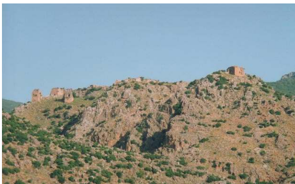
Fig. 4 : Château de Burzayh. Vue générale depuis le sud-est.