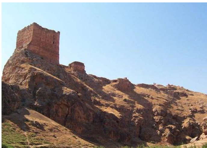
Fig. 5 : Château de Şayzar. Vue générale depuis le sud-est.

Deux facettes complémentaires de l'exercice du pouvoir par Saladin sont ainsi révélées au travers de deux politiques défensives distinctes menées à la fin du XII e siècle : en Égypte, la soumission des Fatimides passa par la mise en œuvre d'un grand programme de fortification du Caire et de campagnes de fortification sur les principales zones stratégiques que Saladin supervisa en grande partie. Dans le Bilād al-Şām, le système de délégation d' iqṭā' pratiqué par Saladin à très grande échelle sur les territoires pris aux croisés ou aux Nūrīdes engendra des politiques de fortification individuelles ordonnées et mises en œuvre par les muqṭā' désireux d'acquérir par ce biais un semblant d'autonomie militaire et financière. Cette politique se révéla à double tranchant puisque, si elle permit l'émergence d'un grand nombre de programmes de fortification « privés » dans le Bilād al-Şām sans que le sultan ait eu à les superviser comme en Égypte, elle favorisa aussi l'émergence d' iqṭā' puissants que ses successeurs eurent des difficultés à maintenir sous contrôle.