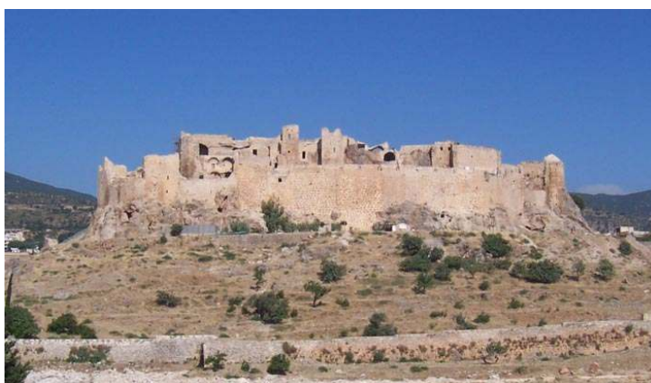
Fig. 8 : Citadelle de Maşyāf. Vue générale depuis l'est.

Enfin, le territoire des Isma'iliens, enclave chiite constituée au milieu du XII e siècle au cœur de la chaîne montagneuse syrienne, en bordure de la principauté d'Alep sunnite et des États latins, parvint à maintenir ses frontières à cette époque par la mise en œuvre de programmes de fortification « locaux » sur les châteaux principaux parmi lesquels Maşyāf jouait le rôle de capitale (fig. 8) 11 .