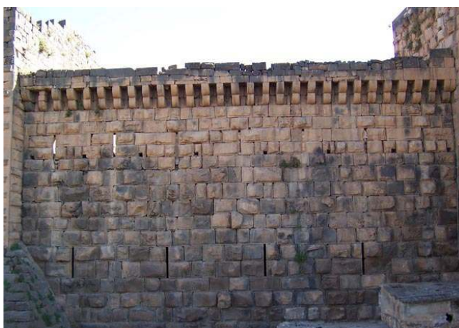
Fig. 10. Citadelle de Bosra. Galerie de mâchicoulis mamelouke sur la courtine sud-est.

confirmant une supériorité militaire et politique en cette fin du XIII e siècle qui autorisait l'introduction du décor au sein de bâtiments initialement dévolus à la défense. Les inscriptions dédicatoires louant le génie constructif des sultans furent alors mises en valeur grâce à des motifs décoratifs (bas-reliefs de félins et motifs floraux encadrant les bandeaux épigraphiques du règne de Baybars comme au Crac des Chevaliers, à 'Akkar, au Caire) et grâce à des jeux de couleurs (alternances d'assises de calcaire et de basalte comme dans le château de Marqab). Les organes de défense devinrent également à cette époque les supports de décorations, comme les fenêtres de tir surmontées de moulures en arabesque (Crac des Chevaliers).