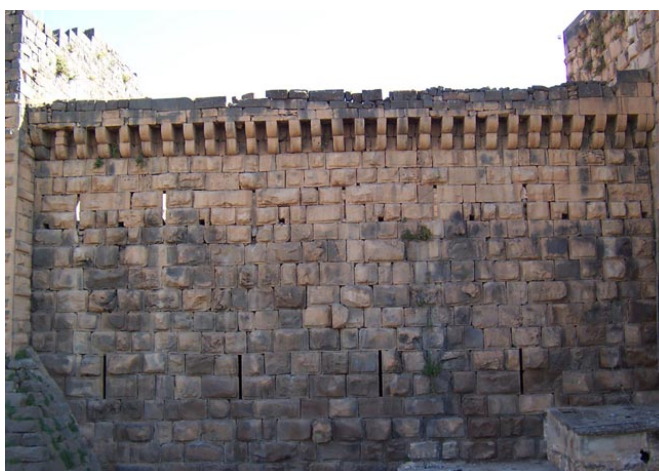
Fig. 10. Citadelle de Bosra. Galerie de mâchicoulis mamelouke sur la courtine sud-est.

confirmant une supériorité militaire et politique en cette fin du XIII e siècle qui autorisait l'introduction du décor au sein de bâtiments initialement dévolus à la défense. Les inscriptions dédicatoires louant le génie constructif des sultans furent alors mises en valeur grâce à des motifs décoratifs (bas-reliefs de félins et motifs floraux encadrant les bandeaux épigraphiques du règne de Baybars comme au Crac des Chevaliers, à 'Akkar, au Caire) et grâce à des jeux de couleurs (alternances d'assises de calcaire et de basalte comme dans le château de Marqab). Les organes de défense devinrent également à cette époque les supports de décorations, comme les fenêtres de tir surmontées de moulures en arabesque (Crac des Chevaliers).