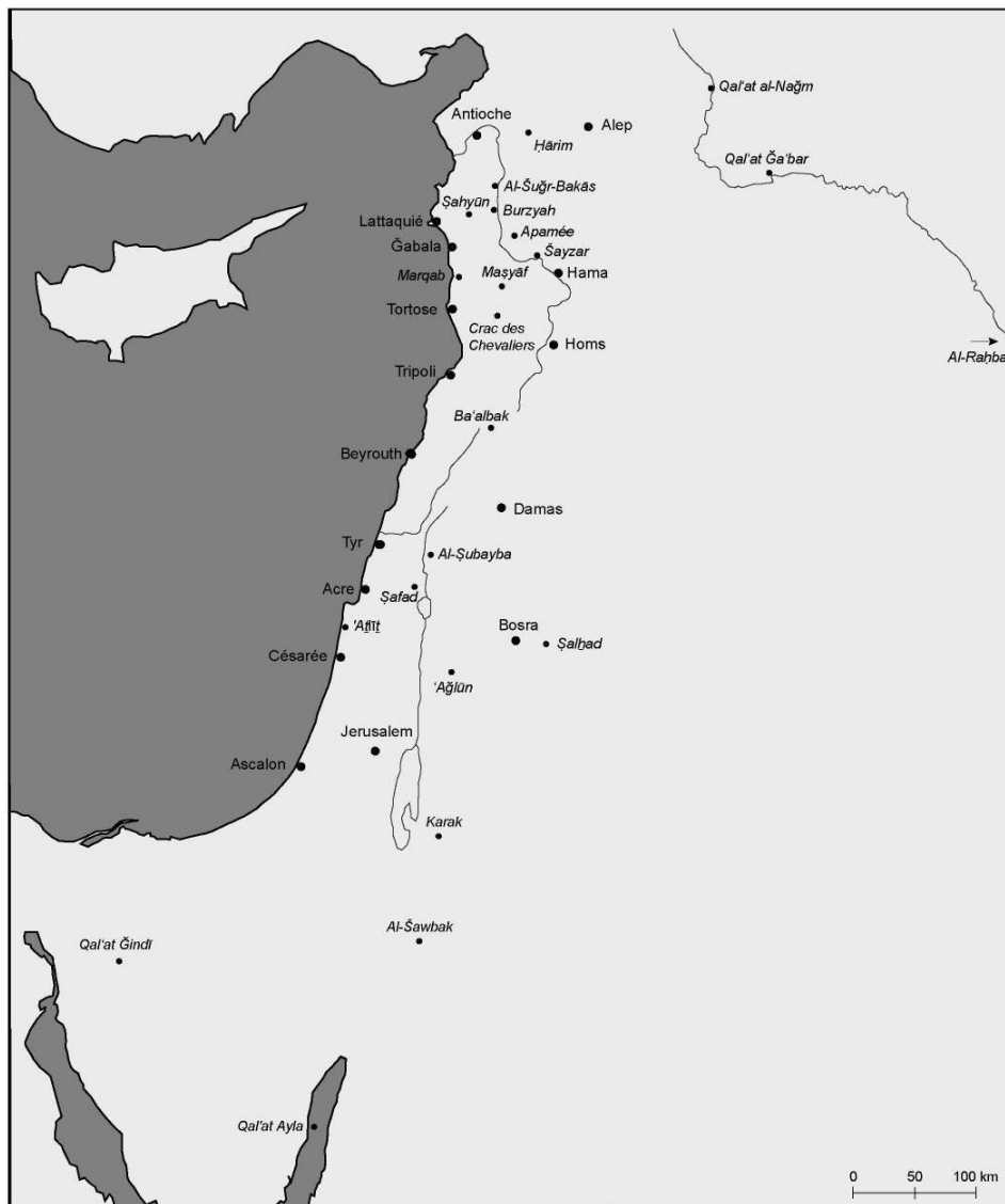
Fig.1 : Principaux sites fortifiés du Bilād al-Šām à l'époque des croisades

Dès l'année 1170-1171, Saladin avait entrepris en tant que vizir du pouvoir fatimide en Égypte des travaux de fortification limités par de faibles moyens financiers et qui répondaient surtout à des considérations défensives, quelques années après la campagne militaire croisée de 1168 d'Amalric qui parvint jusqu'aux portes du Caire et après l'expédition maritime byzantino-croisée de 1169 contre Damiette. Il fit ainsi restaurer les murailles fatimides du