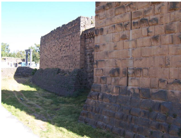
Fig. 6 : Citadelle de Bosra. Tours et courtines à l'angle sud-est de la citadelle.

À la différence de Saladin qui ne supervisa véritablement les programmes de fortification qu'en Égypte, ses successeurs à la tête l'empire ayyoubide se montrèrent particulièrement soucieux de la mise en défense de l'ensemble du Bilād al-Šām, en particulier au niveau des frontières entre les principautés ayyoubides et les États latins. Ils financèrent de nombreux chantiers de construction, intervinrent directement sur l'évolution des travaux en inspectant régulièrement les positions fortifiées principales. L'application de cette politique de fortification à grande échelle comme instrument de l'extension de l'autorité du souverain sur l'ensemble de son territoire contribua à l'émergence d'une fortification islamique originale, aux caractères défensifs uniformisés et standardisés.