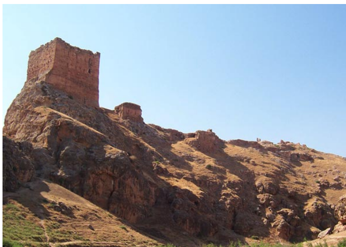
Fig. 5 : Château de Şayzar. Vue générale depuis le sud-est.

Deux facettes complémentaires de l'exercice du pouvoir par Saladin sont ainsi révélées au travers de deux politiques défensives distinctes menées à la fin du XII e siècle : en Égypte, la soumission des Fatimides passa par la mise en œuvre d'un grand programme de fortification du Caire et de campagnes de fortification sur les principales zones stratégiques que Saladin supervisa en grande partie. Dans le Bilād al-Šām, le système de délégation d' iqṭā' pratiqué par Saladin à très grande échelle sur les territoires pris aux croisés ou aux Nūrīdes engendra des politiques de fortification individuelles ordonnées et mises en œuvre par les muqṭā' désireux d'acquiescer par ce biais un semblant d'autonomie militaire et financière. Cette politique se révéla à double tranchant puisque, si elle permit l'émergence d'un grand nombre de programmes de fortification « privés » dans le Bilād al-Šām sans que le sultan ait eu à les superviser comme en Égypte, elle favorisa aussi l'émergence d' iqṭā' puissants que ses successeurs eurent des difficultés à maintenir sous contrôle.