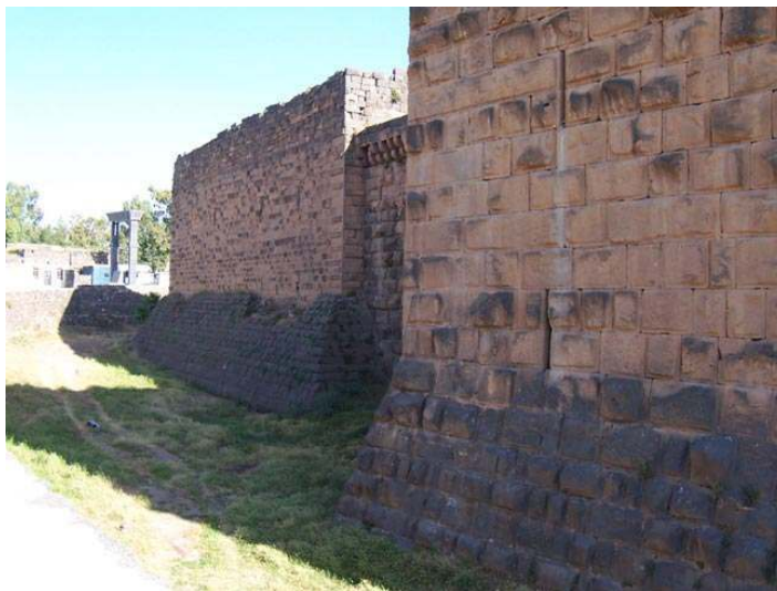
Fig. 6 : Citadelle de Bosra. Tours et courtines à l'angle sud-est de la citadelle.

À la différence de Saladin qui ne supervisa véritablement les programmes de fortification qu'en Égypte, ses successeurs à la tête l'empire ayyoubide se montrèrent particulièrement soucieux de la mise en défense de l'ensemble du Bilād al-Šām, en particulier au niveau des frontières entre les principautés ayyoubides et les États latins. Ils financèrent de nombreux chantiers de construction, intervinrent directement sur l'évolution des travaux en inspectant régulièrement les positions fortifiées principales. L'application de cette politique de fortification à grande échelle comme instrument de l'extension de l'autorité du souverain sur l'ensemble de son territoire contribua à l'émergence d'une fortification islamique originale, aux caractères défensifs uniformisés et standardisés.