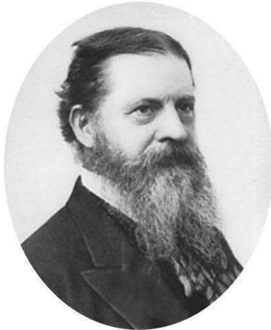
Figure 1 : Charles Sanders Peirce (1839-1914) ; ci-dessous, incipit de l'article BibNum (1877)