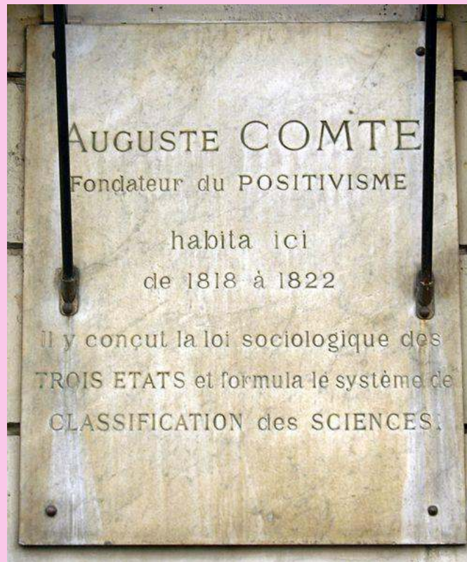
Figure 4 : Plaque apposée au n° 36 de la rue Bonaparte, Paris 6 e

méthode d'autorité et la méthode a priori. Certes, leurs positions sont différentes. L'un parle d'état là où l'autre parle de méthode. La loi des trois états est une loi sociologique, étroitement associée à une philosophie de l'histoire absente chez Peirce. Mais la différence est moins grande qu'elle ne paraît : Peirce prend soin de souligner que la succession des méthodes marque un progrès, et les états chez Comte sont caractérisés par l'emploi d'une certaine méthode.