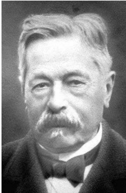
Figure 2 : Édouard Stephan (1837-1923), normalien, astronome français, directeur de l'Observatoire de Marseille de 1866 à 1907.

Le télescope de 1m20 ne donnera rien non plus.