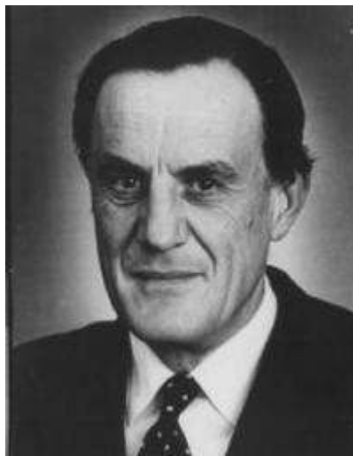
Figure 5 : Robert Hanbury Brown (1916-2002), astronome britannique, FRS Fellow of the Royal Society.

dispositif électronique central mesure la corrélation entre les signaux issus de ces deux détecteurs, laquelle est positive lorsque le diamètre apparent de l'étoile est plus petit que 1,22 \lambda/d , comme pour l'interférométrie classique. Bien que les physiciens aient initialement du mal à comprendre les processus impliqués 6 , cela fonctionne et les deux scientifiques réussissent ainsi à mesurer en 1956 le diamètre apparent de Sirius. Ceci va les encourager à construire en Australie un grand interféromètre d'intensité avec lequel ils mesureront avec une très bonne précision le diamètre apparent de 32 étoiles.