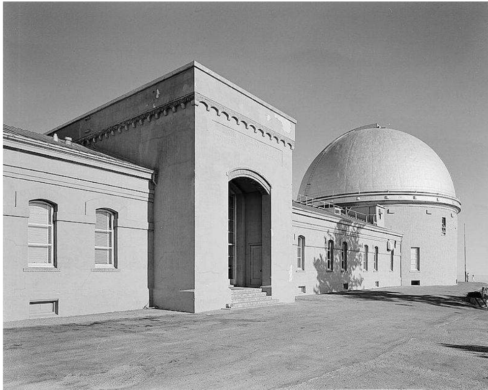
Figure 3 : Observatoire Lick, Mount Hamilton, San Jose, Californie. Vue du bâtiment principal d'origine. L'observatoire a été construit à partir des années 1880.