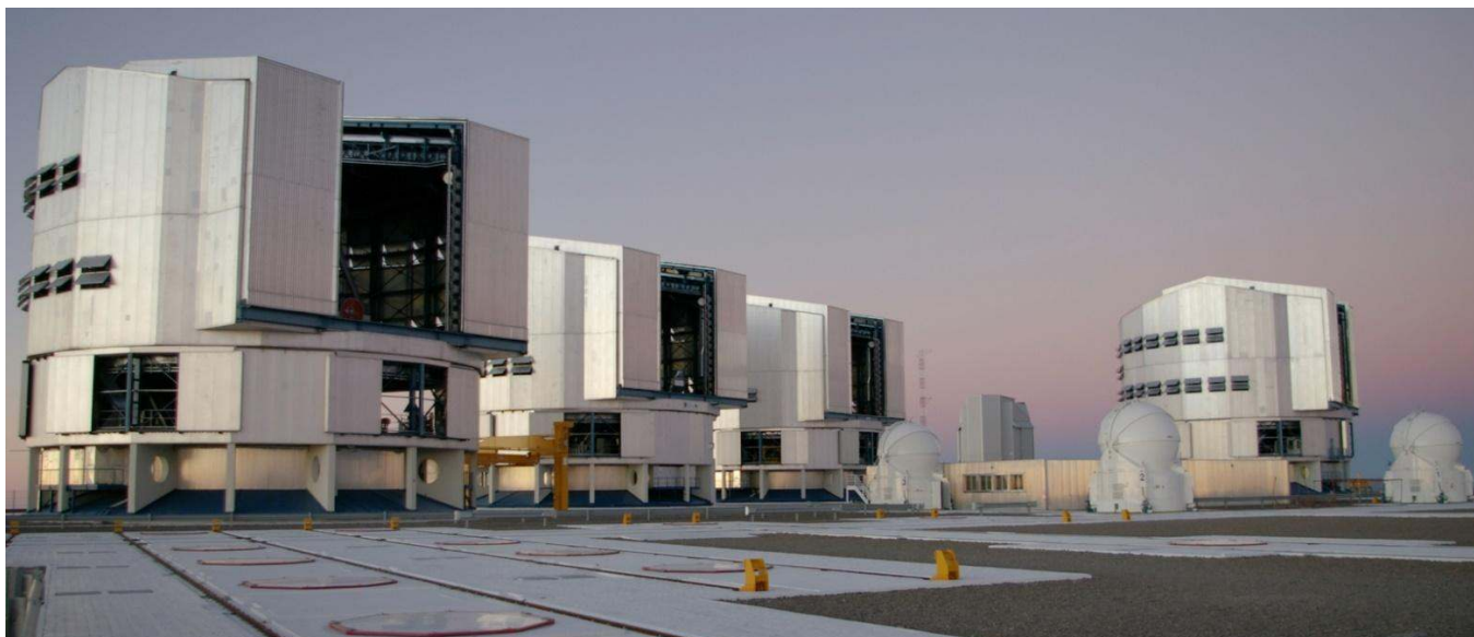
Figure 6 : Observatoire ESO, désert d'Atacama, 2635 m, Chili (depuis 2000). Plateforme VLT, avec UT1 (Unit Telescop 1) à UT4 – diamètre 8m chacun ; trois des quatre télescopes auxiliaires AT- diamètre 1,8m chacun ; entre UT3 et UT4, au fond, le télescope VST.