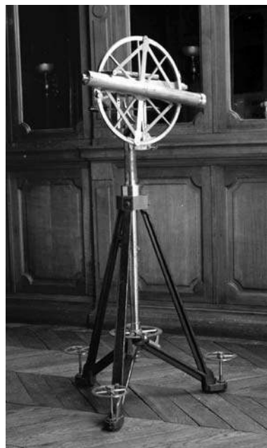
Figure 3. Le cercle répéteur de Fortin de l'Observatoire de Paris.

Page d'un cahier autographe d'Arago où il reporte le résultat final de ses premières mesures avec le prisme achromatique. Il y indique la différence de déclinaison de diverses étoiles mesurée avec et sans prisme avec les deux divisions opposées d'un cercle mural, puis leur moyenne, c'est-à-dire la déviation de ce prisme. On voit que les différences d'une étoile à l'autre ne sont que de quelques secondes de degré, dues seulement aux erreurs de mesure.