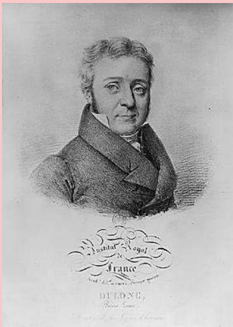
Figure 5 : Le physicien Pierre-Louis Dulong.

La théorie cinétique des gaz, puis celle des oscillateurs harmoniques cristallins pour les solides, allaient expliquer plus tard le facteur 3 comme lié aux trois degrés de liberté possédés par l'atome.