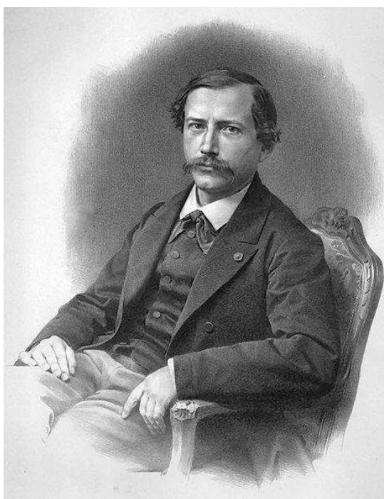
Figure 2 : Marcelin Berthelot (1827-1907).

Marcelin Berthelot (1827-1907) avait publié, au tout début de cette même année 1874 (livraison du 3 janvier), un article dans la Revue rose , sur «La nature des éléments chimiques 3 ». Berthelot, au moment où il publie cet article, s'est donné une assise institutionnelle forte, il est depuis 1865 et une nomination acquise au moyen d'appuis politiques, professeur au Collège de France. Il est aussi membre de l'Institut, depuis l'année précédente (1873) seulement, après trois tentatives infructueuses en 1866, 1867 et 1868. En 1869, Berthelot obtint un supplément de crédits de fonctionnement pour son laboratoire, affilié à l'École pratique des Hautes Études, créée en 1868 4 .