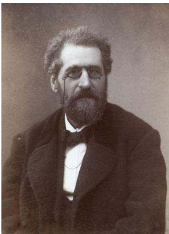
Figure 1 : Édouard Grimaux.

Le chimiste Édouard Grimaux (1835-1900) a eu un parcours particulier et relativement méconnu. À l'origine pharmacien militaire puis d'officine en Vendée, il part à Paris et devient chimiste expérimental de talent à partir des années 1860, travaillant sur les aldéhydes pour la synthèse des colorants et la conception de médicaments. Répétiteur puis professeur de chimie à l'École polytechnique (1877-1898), il est connu pour ses prises de position en faveur de Dreyfus (notamment son témoignage au procès Zola en 1898) : sa destitution de Polytechnique en 1898 laisse à Grimaux l'image d'un « pur », un martyr de la cause. Sans contester d'aucune façon la valeur et le courage de ses prises de position, nous proposons, sur un tout autre registre, d'apporter un complément à cette image monolithique de Grimaux.