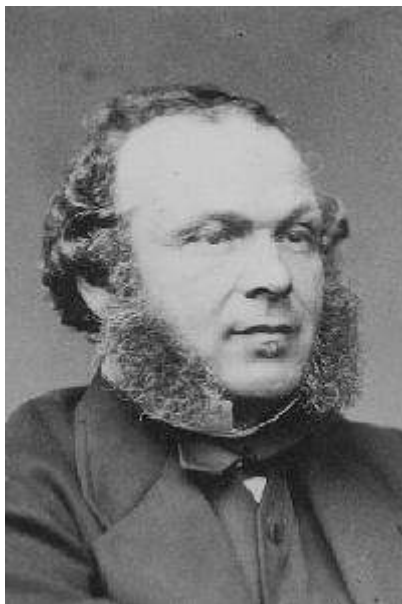
Figure 6 : Adolphe Wurtz (1817-1884), médecin et chimiste. Il fut professeur de chimie à la Faculté de médecine, puis doyen de cette même faculté. Il créa en 1875 la première chaire de chimie organique à la Sorbonne.

sur des sujets d'intérêt national, qu'il s'agisse de méthodes d'enseignement ou de l'industrie chimique 32 . En 1874, Wurtz supervise aussi le Dictionnaire de chimie pure et appliquée , que préparent plusieurs de ses collaborateurs 33 . Sans oublier, à la suite du Traité de Francfort de 1871, une action inlassable de sa part pour la réinsertion à Paris et en région parisienne d'optants alsaciens. Wurtz est débordé, Grimaux ne peut espérer aucune aide, sauf morale, de sa part pour aider son ambition professionnelle.