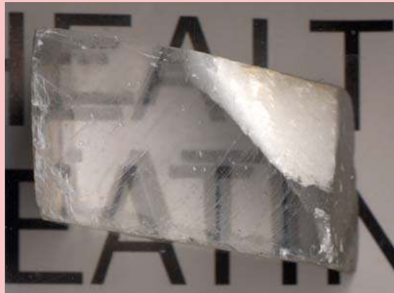
Figure 1 : Double réfraction à travers un cristal de spath d'Islande (calcite \text{CaCO}_3 ). L'image des lettres à travers le cristal, déjà décalée par rapport à l'image ne traversant pas le cristal (effet de réfraction), est par surcroît dédoublée (effet de double réfraction).

La biréfringence (ou double réfraction) est un phénomène dont on observe tôt les effets (Bartholin 1669), mais qui était difficile à analyser puisqu'on ne découvrit le phénomène de polarisation de la lumière que plus d'un siècle après (Malus 1808).