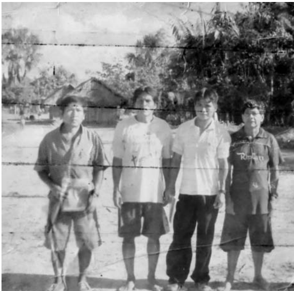
Figura 1 – Miembros de la Iglesia Bíblica Awajún en San Pablo

En los datos reportados por el antropólogo Robert Priest, quien estudió en profundidad el desarrollo de esta Iglesia entre 1987 y 1989 (Priest, 1993), encontramos la descripción de una realidad que asombra por el número de adeptos, la complejidad del discurso religioso propuesto por su fundador y el tipo de actividades desempeñadas. En sus textos, Priest enumera 60 comunidades relacionadas con la Iglesia de Dati. Entre ellas, 120 representantes se reunían periódicamente, en la sede en Tundusa (Priest, 1993: 5) 6 . Entre 2016 y 2017, pude confirmar las cifras elaboradas por Priest a través de testimonios orales recolectados durante mi trabajo de campo en algunas de las comunidades donde sigue vigente la Iglesia Bíblica Awajún 7 ; además, he podido encontrar a algunos de los principales adeptos de Dati que habían participado en la etapa de fundación de la Iglesia 8 .