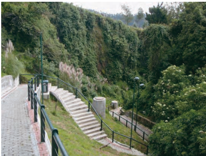
Figura 2 – Acondicionamiento del Parque El Tejar en la quebrada del mismo nombre

Esta etapa incluye igualmente obras de ingeniería civil. Así, la Emaap-Q ha instalado conexiones a lo largo de las quebradas para recoger las aguas usadas de las casas instaladas en las partes altas y evacuarlas hasta la red de saneamiento existente. El núcleo de este equipamiento parece haber sido la instalación de 7 kilómetros de colectores de evacuación de las aguas pluviales y usadas. Esta obra sirve para el buen funcionamiento de la red de saneamiento de la ciudad, pero no directamente para la lucha contra las amenazas. Al reducir la vulnerabilidad de esta red, se reduce también la vulnerabilidad del centro de Quito, pues la probabilidad