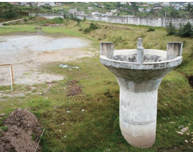
Figura 1 – Obras de protección en la quebrada Rumihurcu

El seguimiento de esta política de acondicionamiento parece haber tenido en cuenta esta visión parcial de la lucha contra el riesgo morfoclimático, al combinar respuesta de ingeniería civil y tratamiento social del espacio.