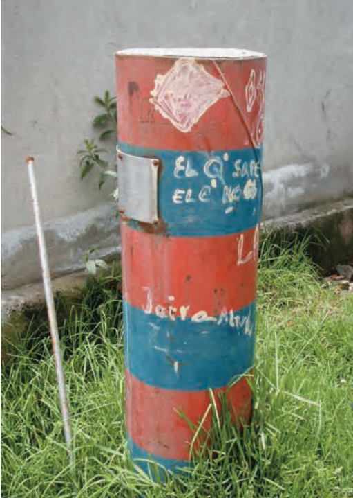
Figura 5 – Hito con los colores de la municipalidad que marca el límite legal de urbanización

de la ciudad, que indican el límite altitudinal de constructibilidad. Estos hitos se encuentran a lo largo de todas las laderas (fig. 5). Las autoridades han instalado igualmente paneles de señalización que alertan sobre los peligros que existen al instalarse más allá de este límite.