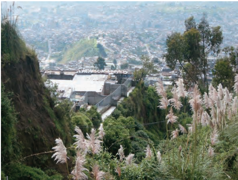
Figura 3 – Quebrada y rejas de protección

Aquí están la mayoría de las quebradas abiertas. A diferencia de las laderas noroccidentales, las partes no rellenadas son menores y más encajonadas, pues