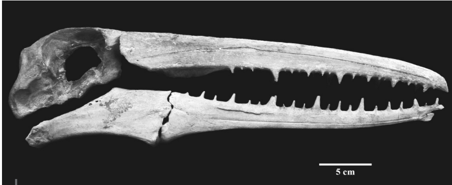
Figura 2 – MUSM 1677 Pelagornithidae.