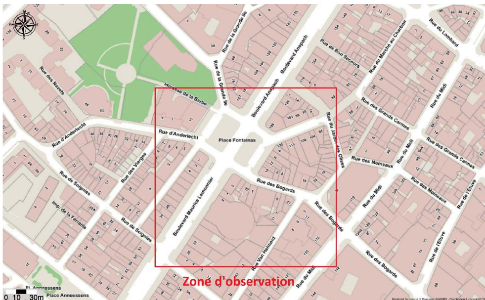
Figuur 1. Uitgebreid plan van het waarnemingsgebied. Gerealiseerd samen met Brussels UrbIS®© - Distribution & Copyright CIRB.

een relatief volledig panel van de weersschommelingen dekten ze dus evenveel de dag als de nacht en de week als het weekend om inzicht te krijgen in de levenswijzen, praktijken, gedragingen en interacties op die plaats. De waarnemingen werden gecombineerd met de afname van veertien interviews met de buurtbewoners en de gebruikers van handelszaken voor homoseksuelen in de wijk (of met buurtbewoners die gebruikmaken van dergelijke handelszaken), waarbij vragen werden gesteld over de ruimtelijke voorstellingssystemen die eigen zijn aan de identiteitsopbouw, het anders-zijn en dus van de grens. Alle interviews werden geanonimiseerd (de gebruikte voornamen zijn fictief) en duurden tussen 45 en 140 minuten. Tijdens deze gesprekken werden tegelijk de trajecten, de identiteiten en de verhoudingen tot de bestudeerde ruimten aangekaart, alsook de stad meer in het algemeen. Er werden ook kaarten gemaakt (zie verder). Door te vertrouwen op een “sneeuwbaaleffect”, werd vooral geronseld door middel van advertenties in Facebookgroepen en het netwerk van onderlinge kennissen. Tot slot werden twee verkennende methoden beproefd: het maken van een mentale geografie van de homoseksuele praktijken in de Brusselse openbare ruimte en van de verklaarde overtredingstrajecten, waarvoor in de openbare ruimte werd rondgewandeld om de normen inzake gender en gaardheid te overtreden teneinde de reacties van het publiek en de ruimtelijke indrukken van de overtreder te verzamelen.