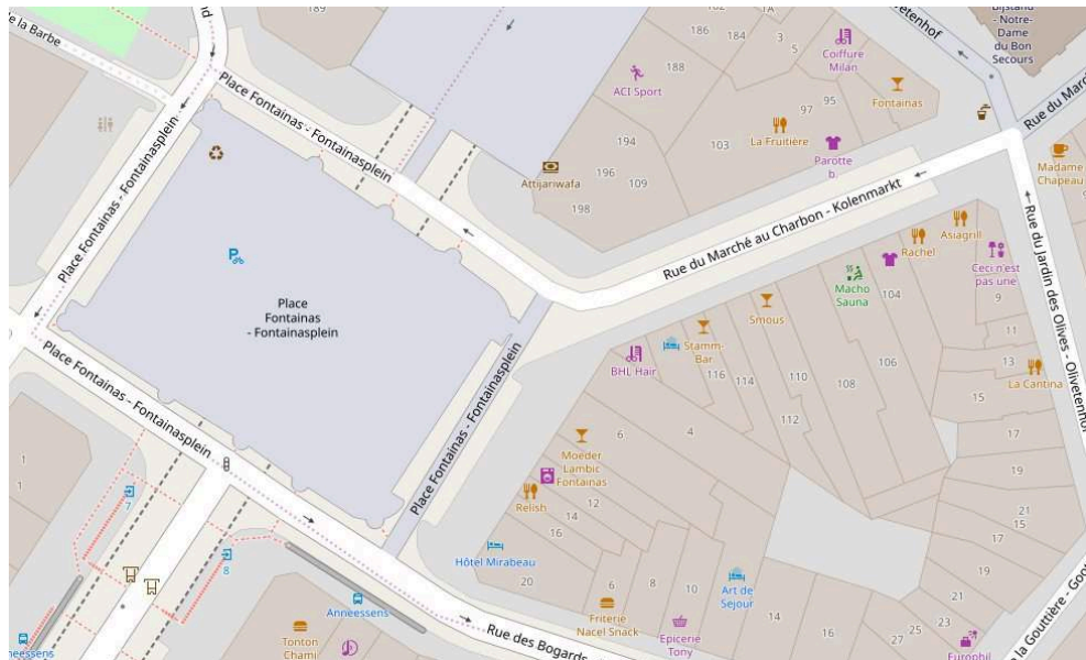
Figuur 2. Kaart van de handelszaken in de Kolenmarkt (schaal 1:800).

Lemonnierlaan, zijn de symbolische tekens van een homoseksuele aanwezigheid radicaal verdwenen.