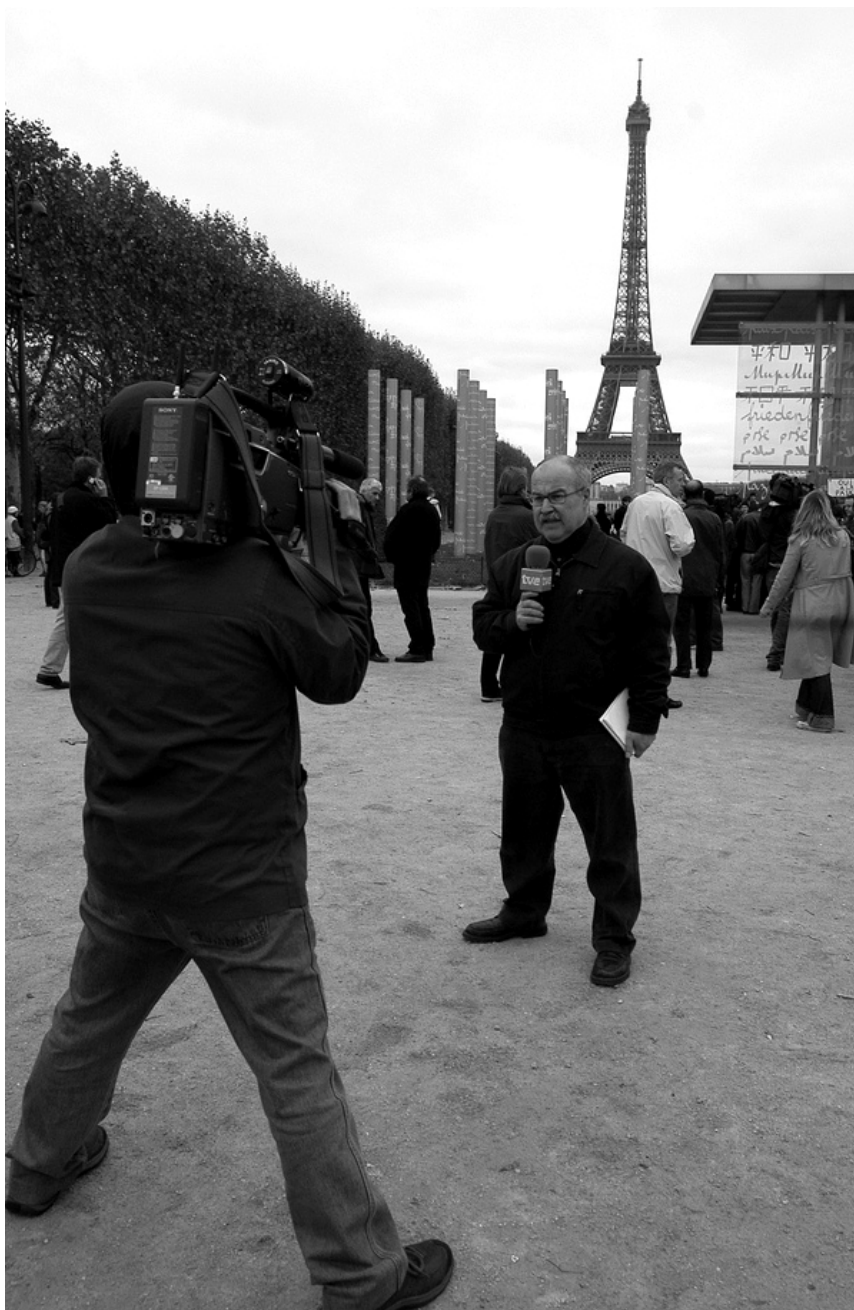
Figure 1. Reporters devant le mur de la paix

Suite à des épisodes d'affrontements entre la police et des habitants de banlieue populaire en région parisienne, des reporters de télévision font un plateau en prenant soin de cadrer la tour Eiffel, symbole de la nation française (20 novembre 2005).