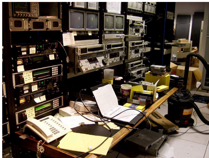
Fig. 1. Dans un studio d'enregistrement (titre original : « Master ») / In a television studio (Original Title : « Master »)

development of new forms of time-shifted viewing, audience peaks are still comparable to those of ten years ago ( ibid. ).