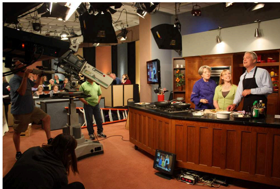
Fig. 2. Tournage d'une émission de cuisine sur KCTS 9 la chaîne de télévision publique éducative de Seattle (États-Unis) / Behind the scenes of "Cooks at Home" on KCTS 9, an educative public television channel in Seattle (USA)