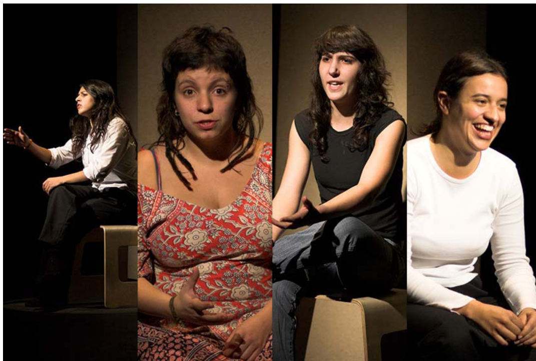
“Entrevistas no futuro”.

Finalmente, a última cena, “Entrevistas no futuro”, recria performativamente o momento de uma entrevista sendo, agora, os próprios performers a performarem-se a si próprios, criando a sua persona , e fazendo uso das novas tendências da arte da performance, onde há um esvaziamento da personagem enquanto representação de um outro.