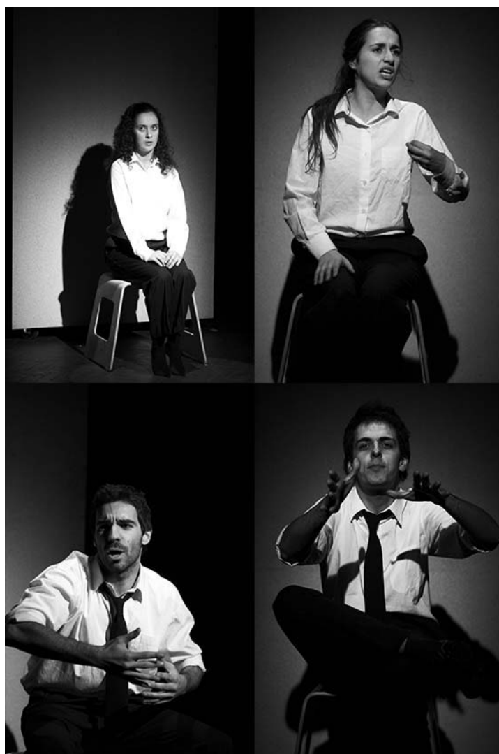
“Entrevistas ao Passado”.

Para a primeira cena, os atores, inspirando-se nos interlocutores, nas entrevistas filmadas e no próprio modelo de entrevista, representam agora, um a um, os entrevistados, transformando o público na câmara de filmar. À medida que o jogo se processa e a assistência entra nele, estabelece-se uma empatia com o espectador, em termos de perceber o tipo de entrevistas que realizámos na etnografia, de como os dados são recolhidos, vividos, evocando, talvez, o processo de produção do conhecimento.