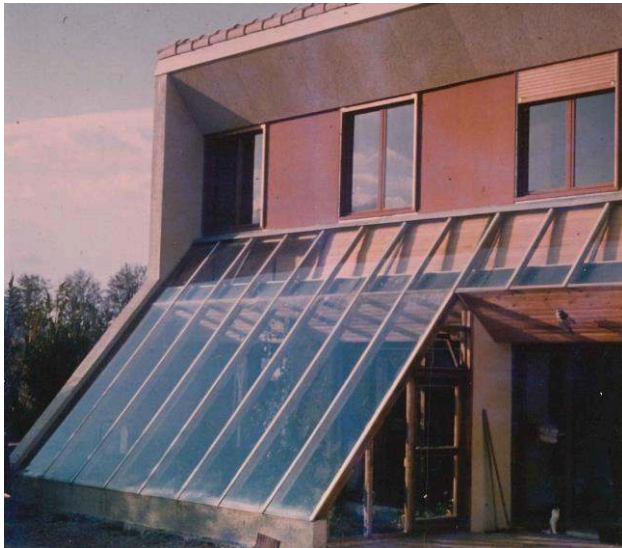
Figure 3 - Maison solaire passive conçue par l'architecte Michel Gerber et construite en 1979 à Ginestas, dans l'Aude (photographie de Lola Vico-Gerber)

On remarque à travers leur propos que les techniques solaires actives sont assimilées à des équipements conventionnels et déjà existants, à l'inverse des techniques passives qui renouvelleraient les formes de l'architecture. Ce point de vue est aussi partagé par certains ingénieurs qui affirment que « [t]out ou partie du gros œuvre d'une construction passive fait partie, par essence, du système thermique » et que « les composants de ce système thermique viennent [...] se confondre avec les composants architecturaux pour former des éléments multifonctionnels » (Rubinstein & Lepoivre, 1982, p. 402). Les maisons solaires passives organisées autour d'une serre illustrent bien ce phénomène (figure 3). Dans ce cas c'est l'ensemble de la construction qui « joue le rôle du corps exposé au soleil » car « ses parois et sa masse propre constituent le système captage/stockage/restitution » (Bardou & Arzoumanian, 1978a, p. 10). Toutes ces fonctions sont dissociées dans une construction équipée d'une technique solaire active.