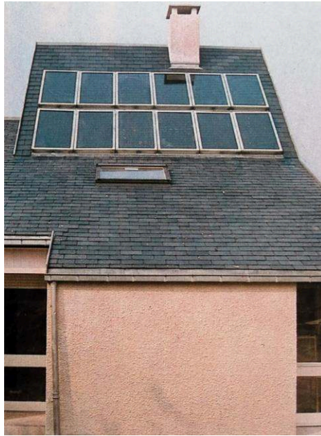
Figure 1 - Capteurs à eau d'une maison solaire active conçue par l'architecte Yves Vatin et construite à la fin des années 1970 en région parisienne (Ménard, 1980, p. 172)