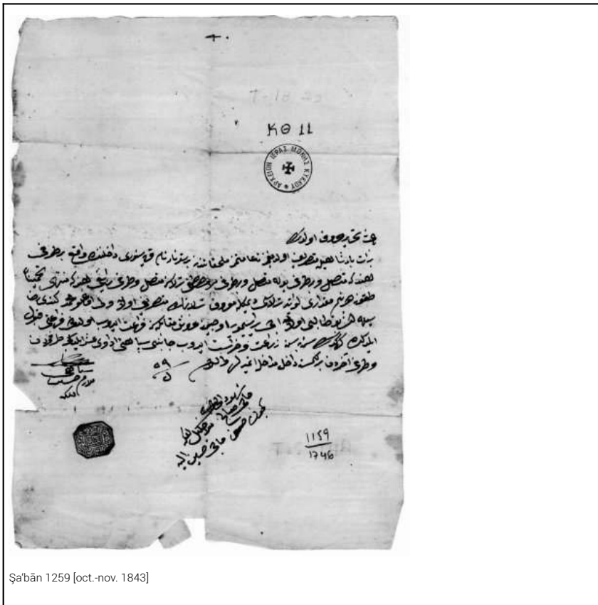
Şabān 1259 [oct.-nov. 1843]