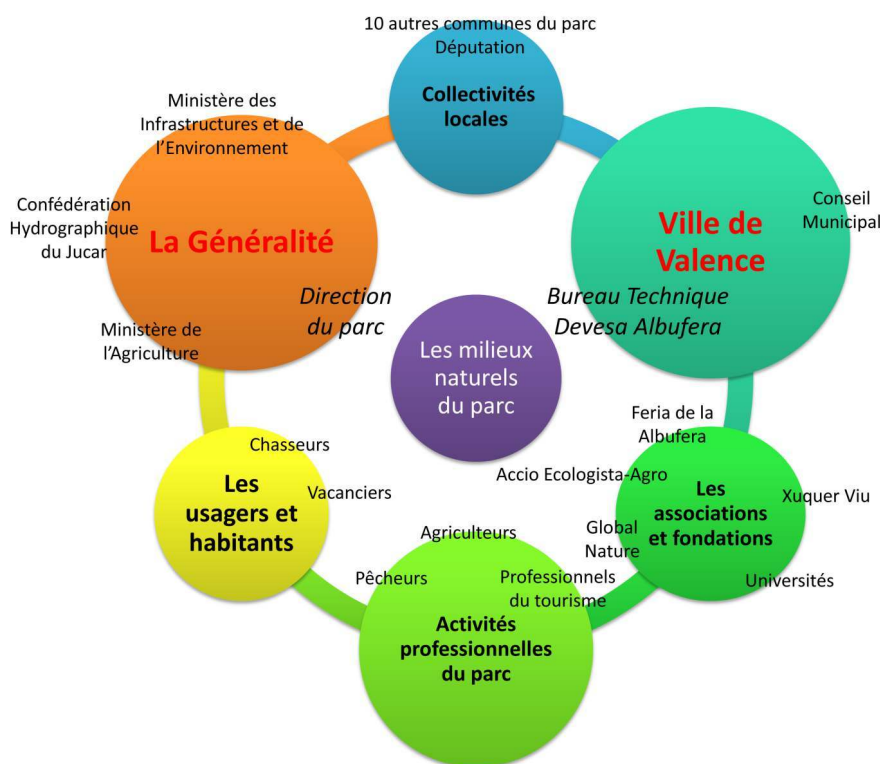
Figure 4. Les principaux acteurs de l'Albufera, plus ou moins proches des milieux naturels, dominés par la Généralité et la Ville de Valencia (situation de 2014)

longs entretiens passionnés, ces contacts et documents donnés si facilement, cet attachement partagé de l'Albufera. Me percevait-on à l'époque comme inoffensive ? J'avais toutefois été très surprise par quelques portes restées fermées, celles des acteurs de la gestion de la quantité d'eau. Lorsque j'ai repris contact en 2014, j'ai été étonnée et heureuse de constater qu'une partie des acteurs rencontrés travaillaient toujours dans les mêmes organismes et qu'ils disaient se souvenir de moi. L'accueil a été encore meilleur qu'en 2004, peut-être compte-tenu de mon nouveau statut mais aussi de mon retour dix ans après. Les entretiens ont été longs, riches, variés et j'ai pu atteindre des personnes de grade plus élevé dans la hiérarchie administrative. J'ai retrouvé le puzzle des acteurs de l'Albufera, dont les multiples pièces me sont apparues plus nettement, mais sans que pour autant elles s'assemblent mieux qu'en 2004 (fig. 4).