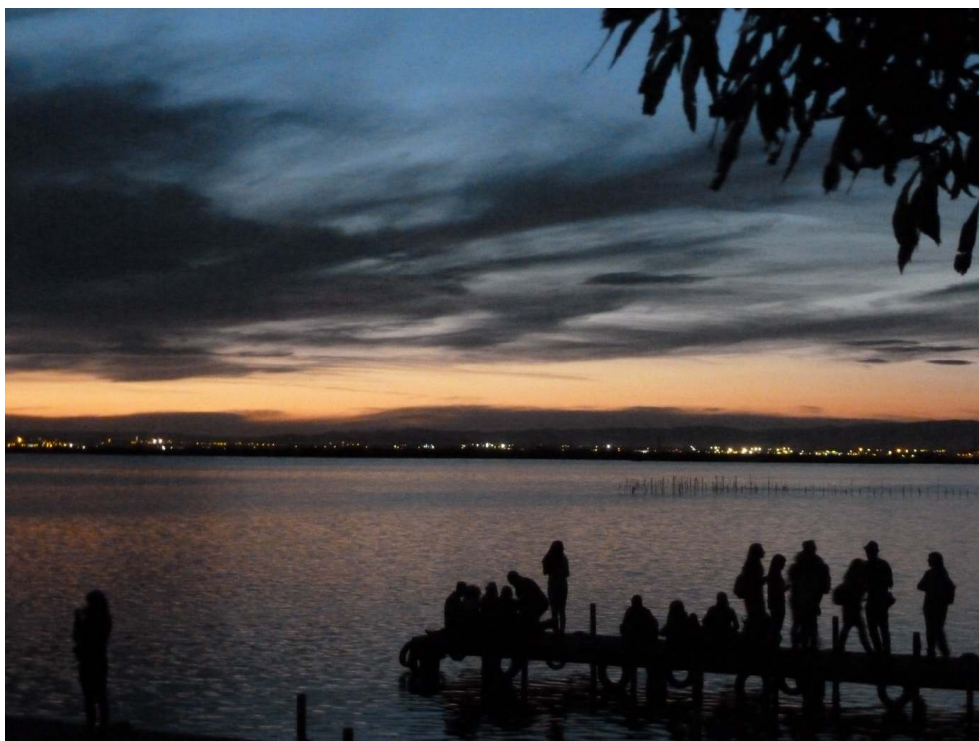
Figure 5. L'observation du coucher du soleil sur la lagune, une des principales attractions touristiques

On aperçoit au second plan les filets de pêche à l'anguille et au fond les lumières de la rive ouest de la lagune, très urbanisée.