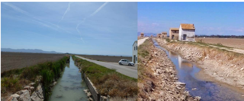
Figure 1. Visages de la zone humide rizicole, dite marjal , et ses canaux

Sur la photographie de gauche on distingue la voiture de location et au fond la Muntanyeta dels Sants, qui se dégage du haut de ses 27m. A droite, une photographie suggérée par la guide Yanina de VisitNatura, avec les casas de motors qui abritent les pompes.