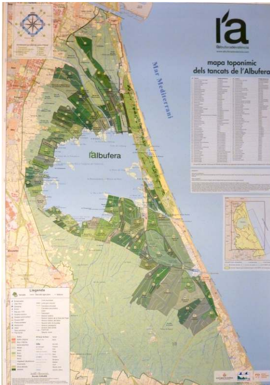
Figure 2. La carte des tancats , dernière somme de connaissances cartographiques de l'Albufera

Les tancats se dégagent en verts plus foncés. Les rizières irriguées par l'eau des fleuves apparaissent en vert pâle. La Devesa est représentée en vert vif et la huerta (les orangeraias et maraîchages) en jaune pâle.