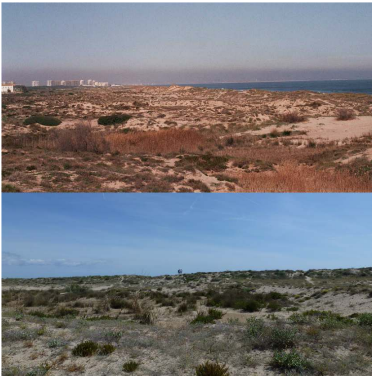
Figure 3. Les restaurations des dunes de la Malladeta, de 2004 à 2014

La photo du haut est prise depuis les dunes du Canyar, montrées par José Luis en 2004, suite à leur restauration en 1991. On aperçoit au milieu à droite les quadrillages de roseaux des dunes de la Malladeta, qui avaient été restaurées de 2001 à 2003. La photo du bas représente ces mêmes dunes de la Malladeta dix ans plus tard.