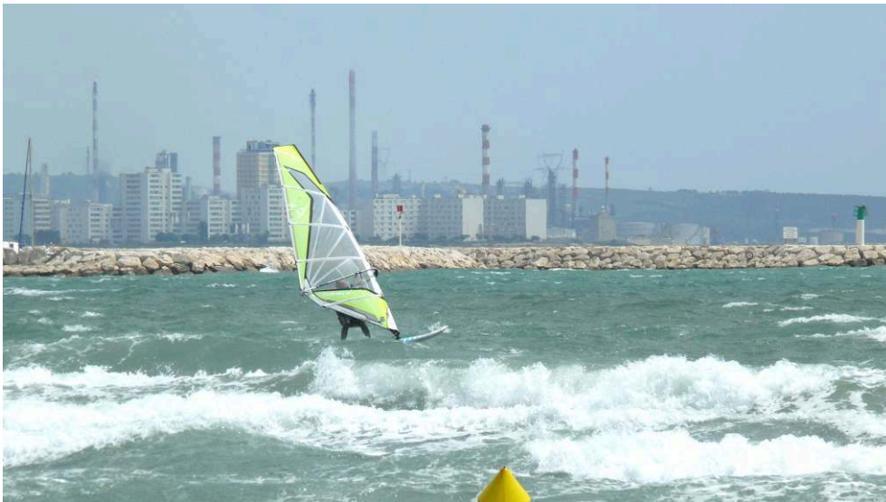
Figure 2 Un territoire industrialo-portuaire aux usages multiples. Sport de mer, quartier urbain et zone industrielle de Lavéra (Martigues).