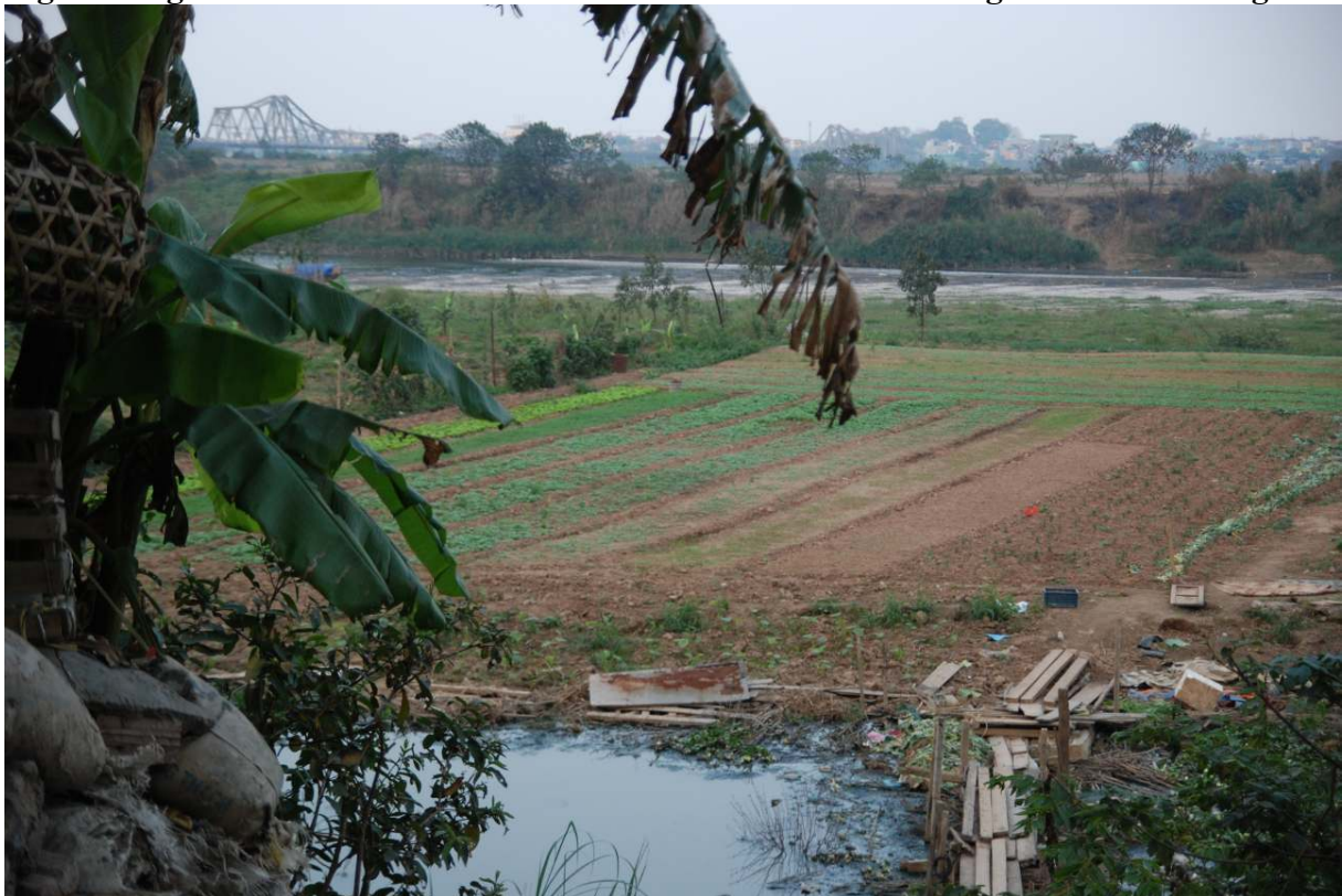
Figure3. Agriculture urbaine à Hanoi : la mise en culture des berges du fleuve Rouge.

Ces inégalités se lisent alors dans la différenciation des pratiques alimentaires et des modèles de consommation : les évolutions du système alimentaire donnent ainsi à voir le processus d'émergence en cours à Hanoi. Ce travail inscrit donc l'étude du système alimentaire dans le cadre plus large des études urbaines dans un pays en développement.