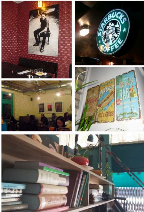
Figure 4 : Décors intérieurs