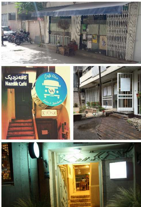
Figure 2 : Enseignes et entrées de cafés à Téhéran

Conception : Gholami Saba.