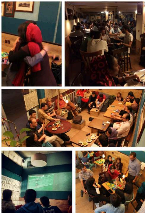
Figure 5 : Ambiances festives dans les cafés de Téhéran