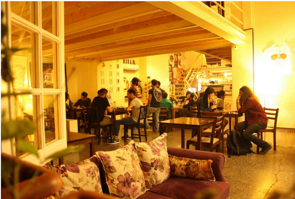
Figure 3 : Ambiance calme dans un café de Téhéran