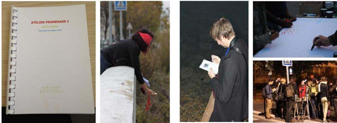
Figure 3 : Atelier promenade à L'Île-Saint-Denis, 2014