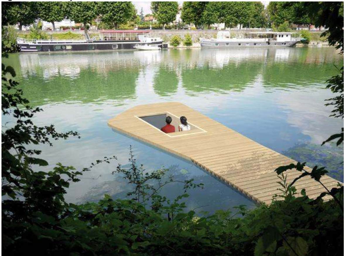
Figure 5 : Contemplation sur l'eau