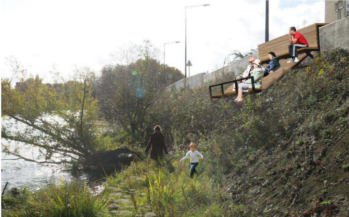
Figure 4 : Renaturation et banc d'observation