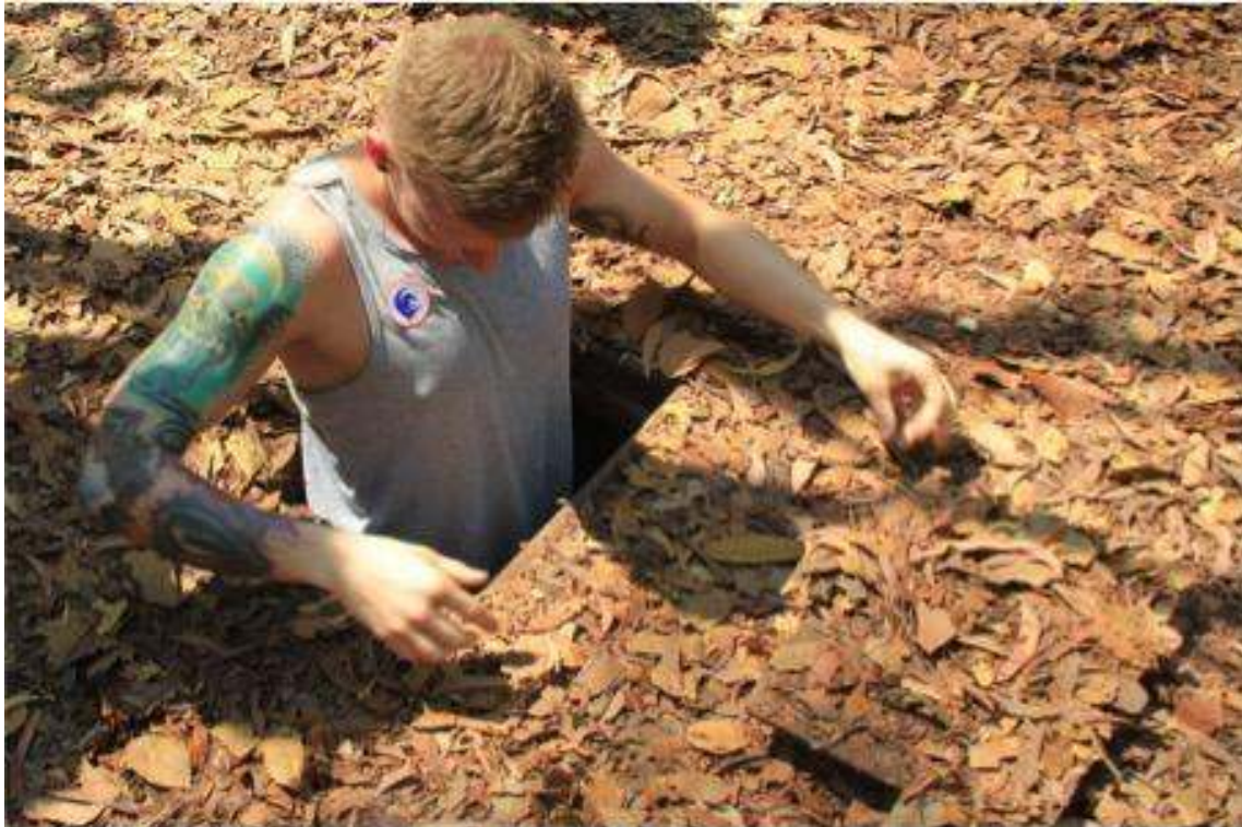
Figure 4 : Expérimentation des tunnels de Cu Chi par les touristes