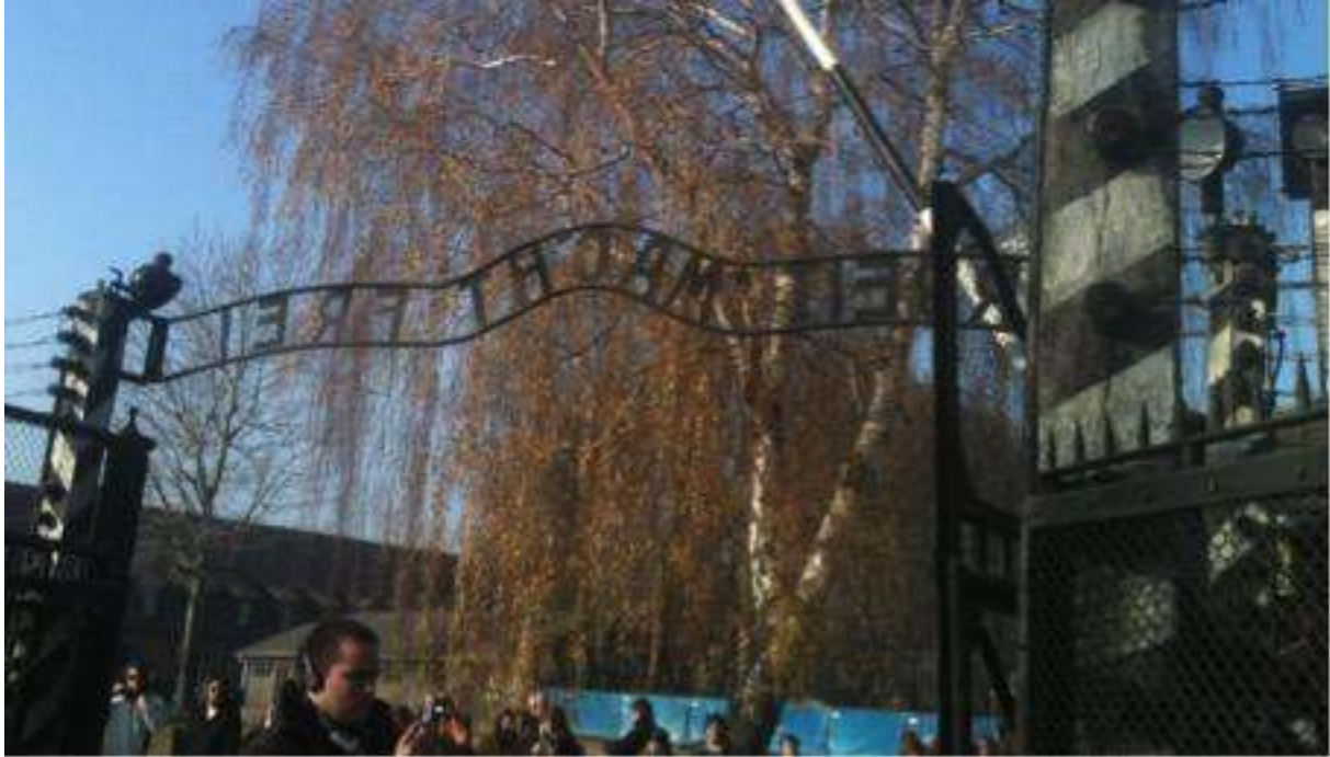
Figure 1 : Entrée d'Auschwitz avec son fameux portail « Arbeit macht frei »

Cliché : Dominique Chevalier, novembre 2011.