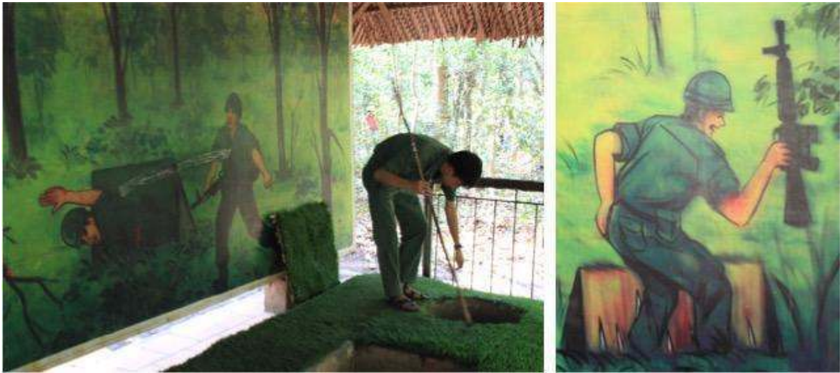
Figure 5 : Démonstration du fonctionnement des pièges et illustrations peintes sur les murs

Cliché : Dominique Chevalier, avril 2015.