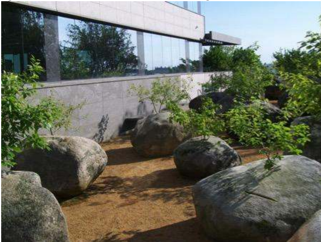
Figure 3 : Jardin de Pierres, Museum of Jewish Heritage, New York

Cliché : Dominique Chevalier, janvier 2008.