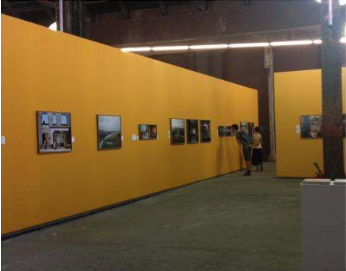
Figure 10 : Exposition I was here , tourisme de la désolation, Rencontres d'Arles

Cliché : Dominique Chevalier, août 2015.