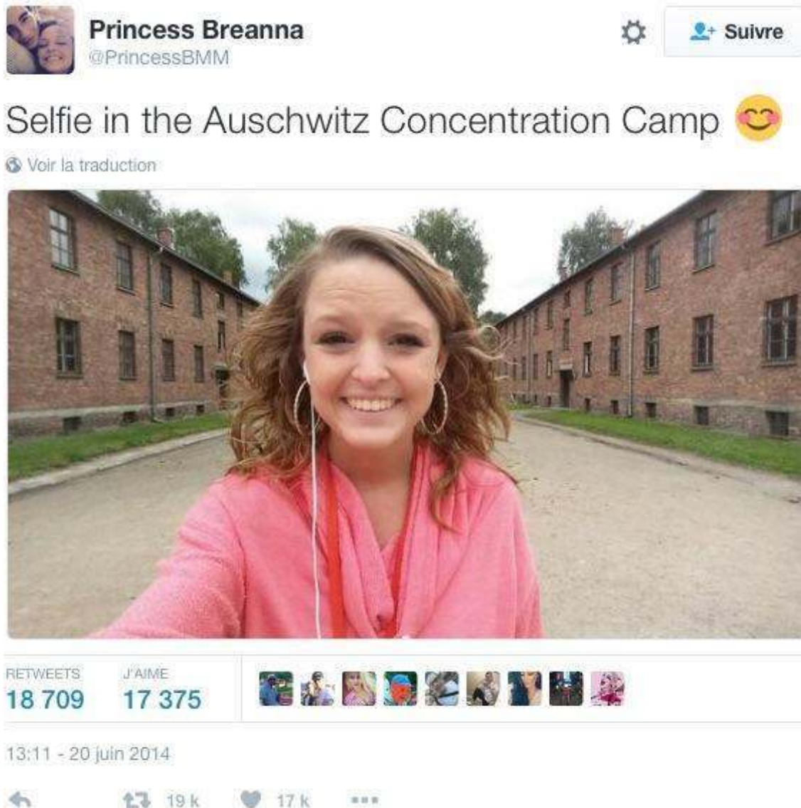
Figure 6 : Selfie posté sur les réseaux sociaux