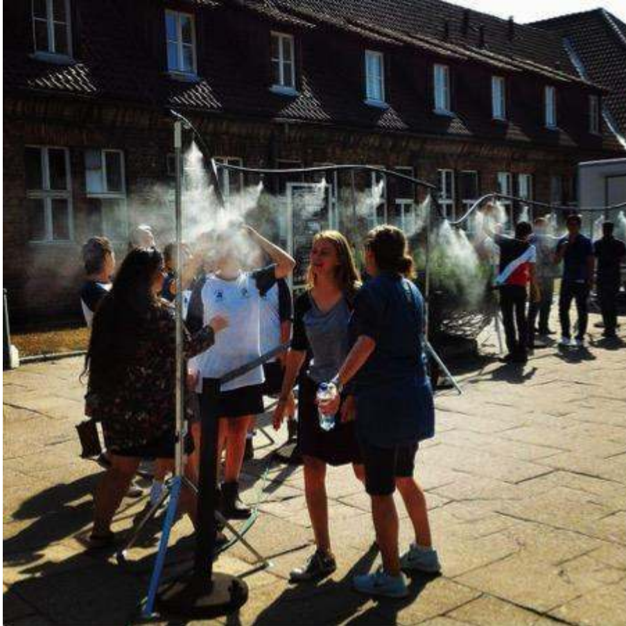
Figure 7 : Brumisateurs/douches installés à Auschwitz