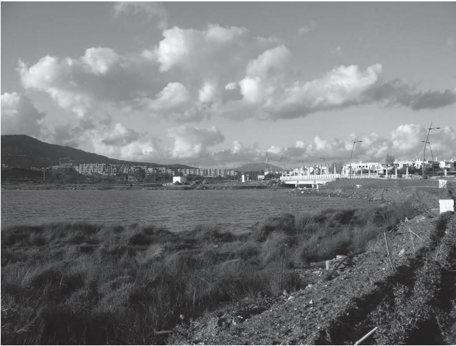
Photo 6. Complexes touristiques de la lagune de Smir

révélateur. Ils sont situés dans l'épicentre de l'une des zones côtières les plus dynamiques d'un point de vue urbanistique. Les transformations de cet endroit côtier singulier ont commencé en 1991, c'est-à-dire bien avant l'escalade du tourisme. L'inauguration en 1991 du barrage de Smir, à la source du fleuve du même nom, a réduit drastiquement les apports d'eau douce au marais et à la lagune, et qui sont ainsi passés de 25 hm 3 à 1 hm 3 par an. Ce phénomène a réduit de 50 % la superficie de ces espaces humides, comme on peut le démontrer grâce aux analyses photographiques réalisées à partir des images antérieures et postérieures à la date de l'inauguration du barrage. À partir de la création de cette infrastructure hydraulique, les apports principaux hydriques que la zone humide a reçus ont été ceux des eaux résiduelles originaires de la localité voisine de M'diq, qui arrivaient à la lagune sans épuration préalable, provoquant ainsi une augmentation notable du niveau d'eutrophisation.