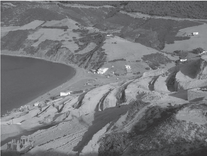
Photo 5. Aménagement du terrain pour construire un complexe touristique

La revitalisation touristique du territoire côtier va associer à la construction dudit « Périphérique méditerranéen » une autoroute gratuite de 550 kilomètres, qui ira de Tanger à Saidia, via Tétouan, et dont les 120 premiers kilomètres sont déjà réalisés. Selon les dernières informations, les études pour la construction des tronçons restants sont très avancées. Cette nouvelle voie de communication reliera l'est et l'ouest du Maroc et facilitera l'accès à une grande étendue de sol urbain à côté d'un littoral absolument vierge. Les promoteurs européens ont senti les possibilités économiques que cette infrastructure va générer, et, depuis longtemps, ils ont pris position. La bande littorale offre de grandes opportunités d'affaires, non seulement au niveau du tourisme mais aussi des résidences secondaires pour les marocains expatriés. La plupart d'entre eux ont quitté le pays pour des raisons économiques pendant les années soixante-dix. L'acquisition de demeures résidentielles est, précisément, l'une des raisons principales de leurs envois d'argent : situation bien connue des promoteurs européens, qui, depuis des années, ont trouvé dans cette collectivité leurs principaux clients.