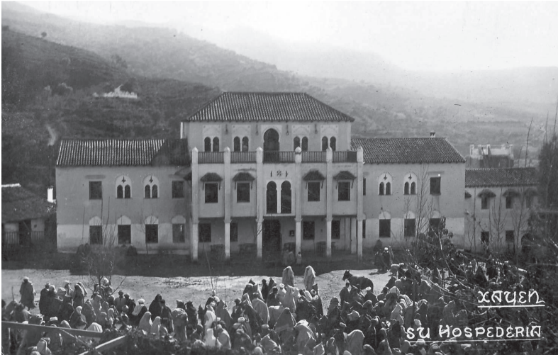
Photo 2. Inauguration du Parador de Xauen

Plus à l'intérieur du pays, l'État espagnol décida la construction du Parador de Xauen , petit édifice sis à la périphérie de la localité de Chauen, dans le but d'offrir un logement aux premiers touristes espagnols, qui aimaient retrouver dans cette ville si particulière une atmosphère andalouse. De son côté, la famille Llodrá, propriétaire de l'entreprise de transports La Valenciana , confia la construction du Parador de Ketama (actuellement Issaguen) à l'architecte José Miguel de la Quadra-Salcedo. Il s'agissait d'un petit établissement touristique initialement pourvu de 27 chambres, une salle à manger principale, deux salons et un bar, lequel se trouvait en dehors du corps principal de l'édifice pour faciliter l'accès aussi bien des hôtes de l'hôtel, que des voyageurs qui parcouraient en autobus ce trajet sinueux 12 . Très rapidement, les entrepreneurs les plus puissants de Tétouan commencèrent à construire près de ce Parador de petites villas, attirés non par les rivages vierges de Río Martín mais par les montagnes âpres et isolées du Rif central.