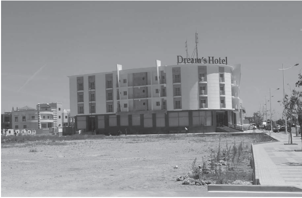
Photo 4. Le nouvel établissement hôtelier à Tétouan

répartis, car toutes les provinces, à l'exception de celle d'Alhucemas, ont au moins un hôtel de cette catégorie.