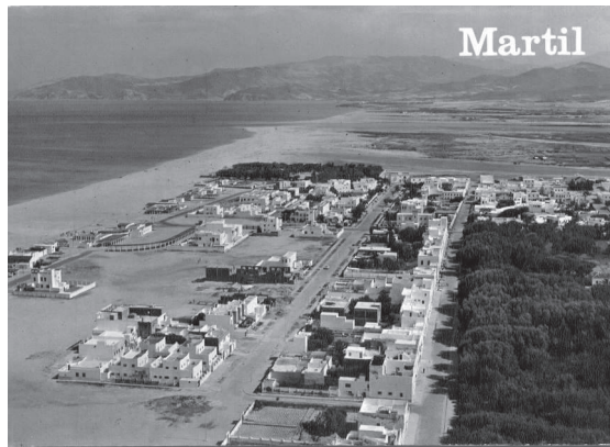
Photo 1. Vue du front de mer de Martil (ex Río Martín) pendant le Protectorat

Au fur et à mesure que Río Martín s'affirmait comme station estivale, les villas se répandirent sur la ligne côtière qui part de la rive gauche de l'embouchure du fleuve. Devant la prolifération des nouvelles demeures, l'Administration espagnole se vit obligée, au début des années Trente, d'établir un réseau d'assainissement et d'égouts, puis, quelques années plus tard, de commencer les travaux pour fournir la ville en eau potable 10 . Cela ne fit que renforcer l'attrait pour un noyau urbain qui devint le rendez-vous estival le plus animé de tout le Protectorat après la pacification du Rif.