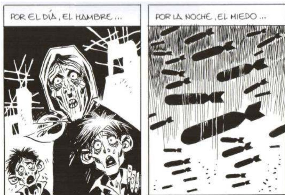
Illustration 3 : Carlos Giménez, 36-39. Malos Tiempos , vol.3, Barcelone, Glénat, 2008, p.7, cases 2-3.