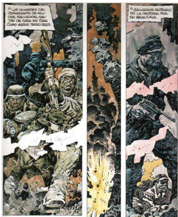
Illustration 2 : AntonioHernández Palacios, Eloy, uno entre muchos , Vitoria, Ikusager, 1979, p. 17, cases 1-2.