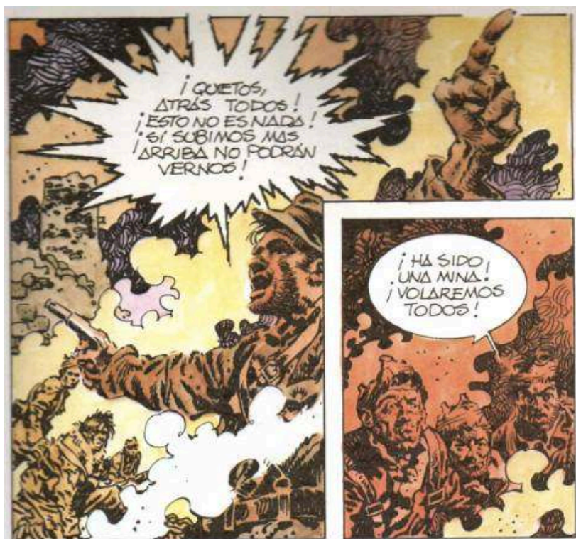
Illustration 1 : Antonio Hernández Palacios, Río Manzanares , Vitoria, Ikusager, 1979, p. 21, cases 1-2-3.