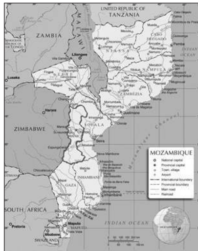
Mapa 1: Província de Manica (Nations Online Project)

Na fronteira entre Moçambique e o Zimbabué encontra-se Mossurize, um distrito moçambicano pertencente à província de Manica e que se situa na parte Sul desta linha de fronteira. A sua capital é Espungabera e os territórios limítrofes são o distrito de Sussundega (a Norte), o distrito de Machaze (a Sul), o distrito de Chibabava (a Leste) e o Zimbabué (a Ocidente). A sua população pertence ao grupo étnico ndau .