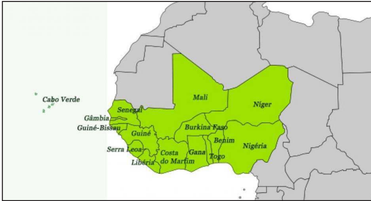
Figura 1: Mapa de la CEDEAO

bros. Para facilitar la buena ejecución de las distintas obligaciones del Protocolo fueron aprobados tres protocolos complementarios, adicionales o todavía suplementarios: el Protocolo A/SP.1/7/85, sobre el Código de Conducta, el Protocolo A/SP.1/7/86, sobre la segunda fase, y el Protocolo A/SP.2/5/90, sobre la tercera fase. Sin embargo, hasta el día de hoy, y con sus propias vicisitudes, solo la primera fase ha sido implementada de forma plena por los Estados miembros. ¿Qué ha pasado? ¿Qué dificultades han tenido los Estados miembros a la hora de poner en marcha las directrices del Protocolo? Estas y otras preguntas son las que nos proponemos contestar a lo largo de este trabajo.