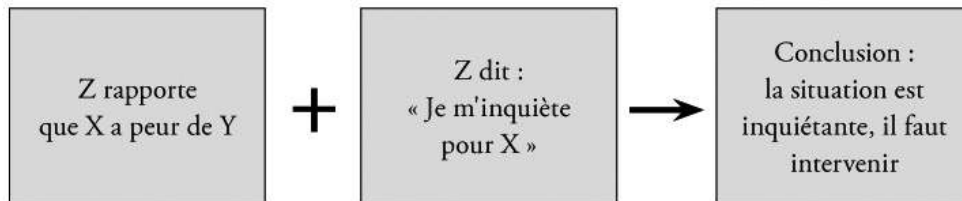
Figure2. L'opération de médiation émotionnelle comme source de cohérence pragmatique du discours

pour enfants, procureur – qui sont habilités à prendre des décisions. Les informations fournies sont-elles à même de provoquer, par le même processus d'empathie, la participation affective des destinataires institutionnels au récit ? Pour le savoir, il faudrait faire une enquête détaillée auprès des destinataires des écrits de signalement, et cela dépasse bien notre propos 26 . En revanche, on peut affirmer que la dimension émotionnelle des écrits de signalement fournit une grille de lecture qui contribue à la cohérence pragmatique du discours :