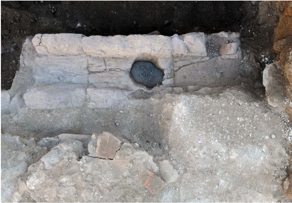
Fig. 3 - Pompéi. Caniveau formé de blocs de tuf volcanique dans de la boutique VII 4, 26 (US 6227).