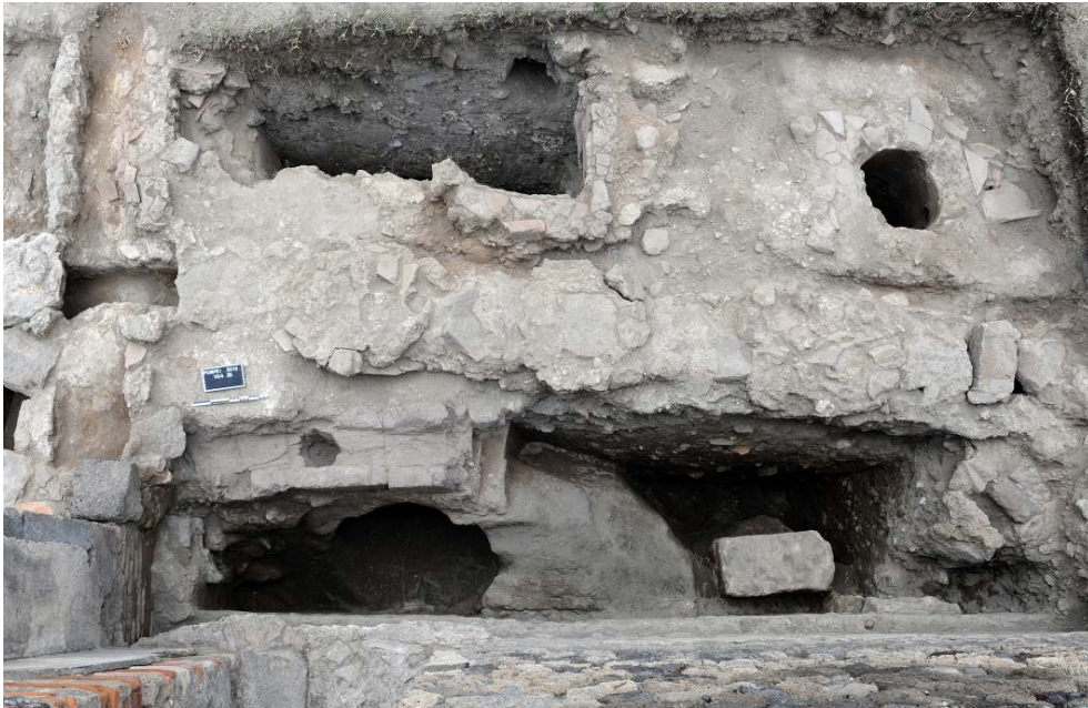
Fig. 2 - Pompéi. Vue générale de la boutique VII 4, 26.