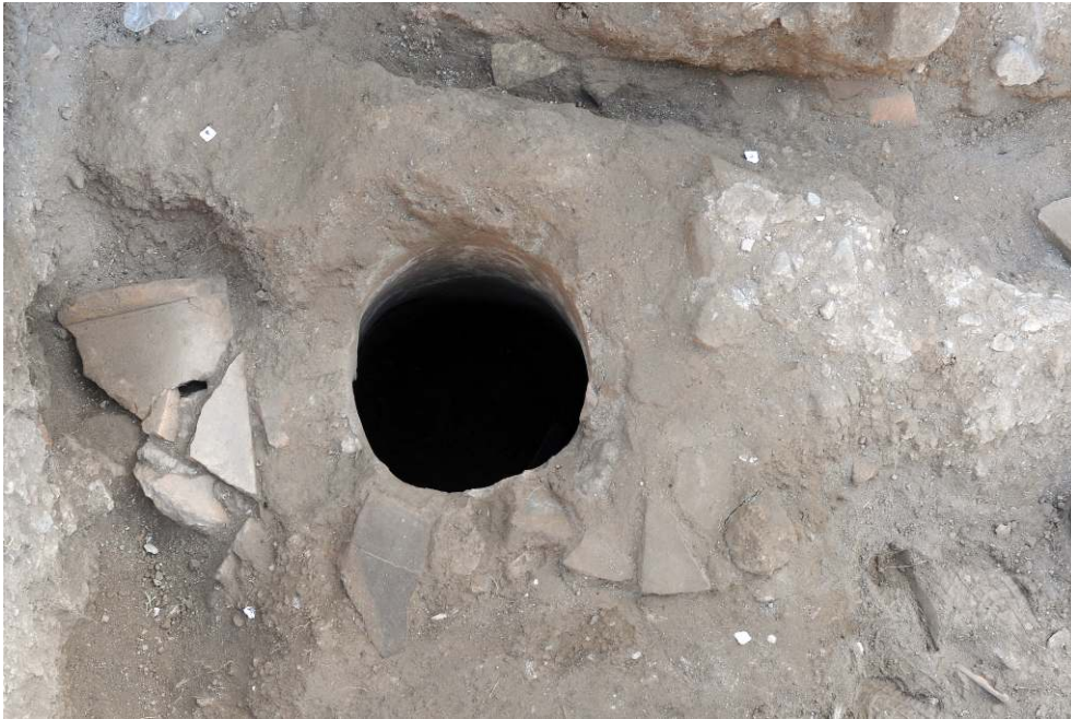
Fig. 4 - Pompéi. Le puits de la boutique VII 4, 26 (US 6218).