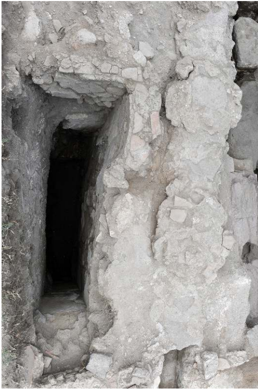
Fig. 5 - Pompéi. La cave de la boutique VII 4, 26 (US 6111).