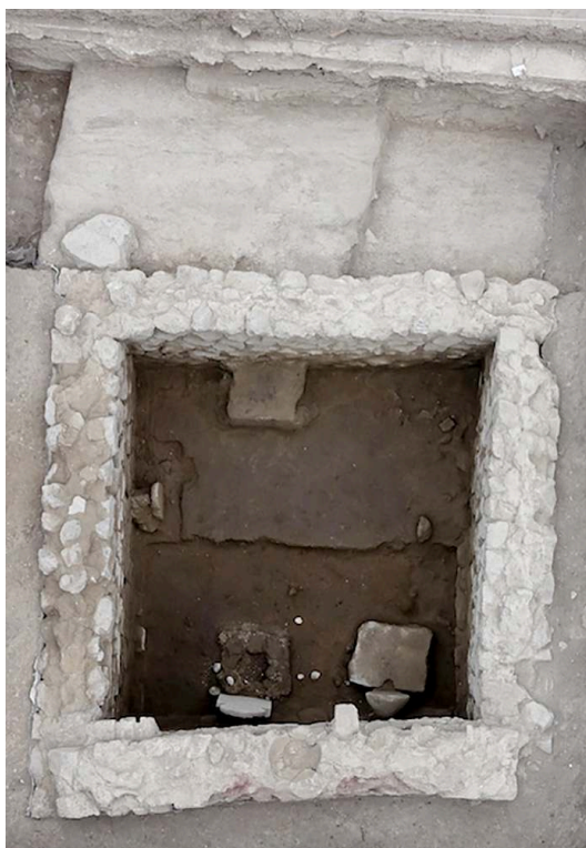
Fig. 3 – Vue zénithale de l'enclos 26a.

Flore Giraud, Mission archéologique de Porta Nocera.