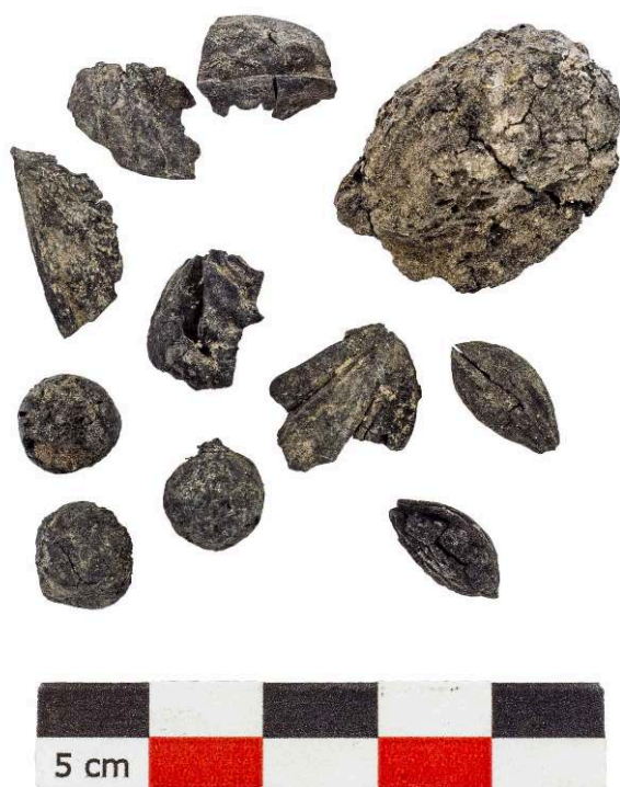
Fig. 5 – Éléments carbonisés retrouvés sur la chaussée.

Ronan Louessard, Mission archéologique de Porta Nocera.