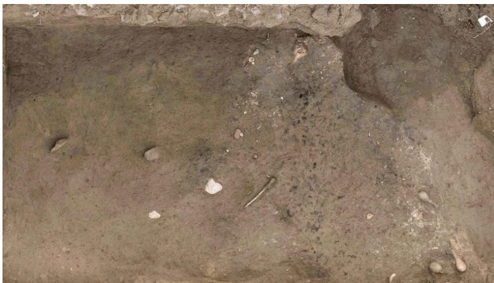
Fig. 9 – Vue générale du bûcher antérieur à la construction de l'enclos 1F.

Sur la droite, le bûcher a été recoupé par une tranchée moderne attribuée aux travaux de 1958. Johannes Laiho, Mission archéologique de Porta Nocera.