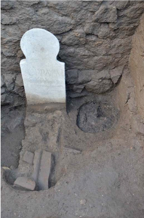
Fig. 4 – La stèle de la sépulture 308 et son système de fixation.