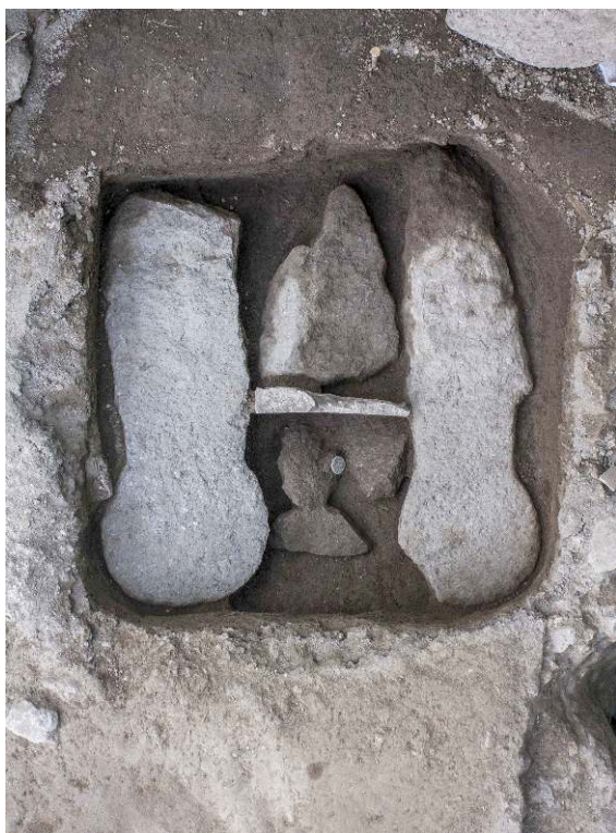
Fig. 7 – Aménagements de SP. 3 après démontage de la mensa .

Ronan Louessard, Mission archéologique de Porta Nocera.