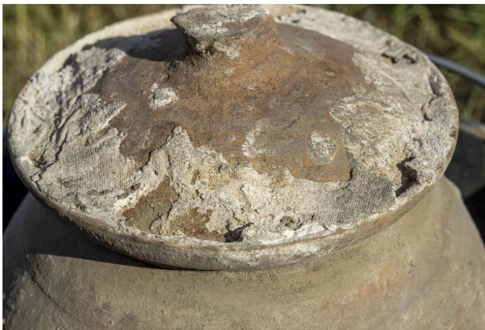
Fig. 8 – Empreintes de textile sur le couvercle de l'urne de la SP 1F6.

William Van Andringa, Mission archéologique de Porta Nocera.