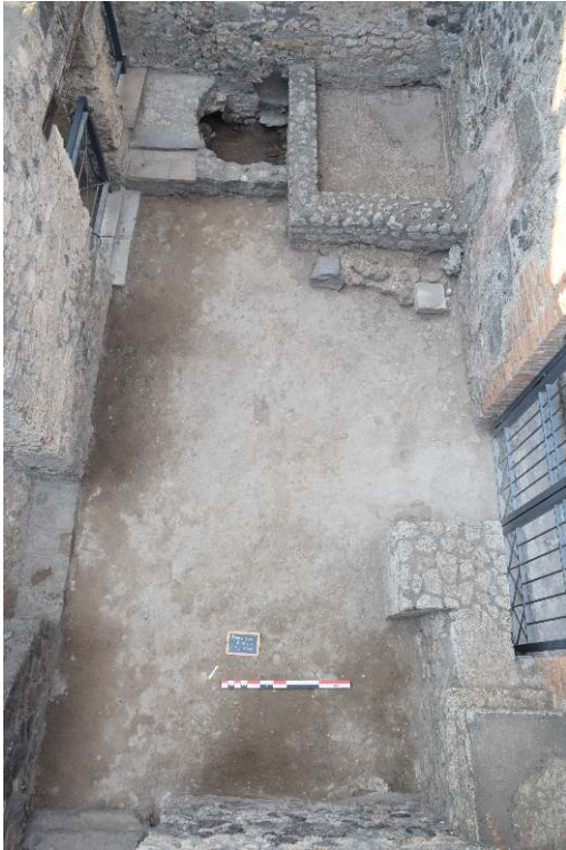
FIG. 3 – ESPACE 1 AVEC LE BASSIN, LA FOSSE SEPTIQUE ET LE COMPTOIR DE VENTE.

vendait. La production de l'atelier de potier ? le vin produit dans le jardin, en vente au détail ?