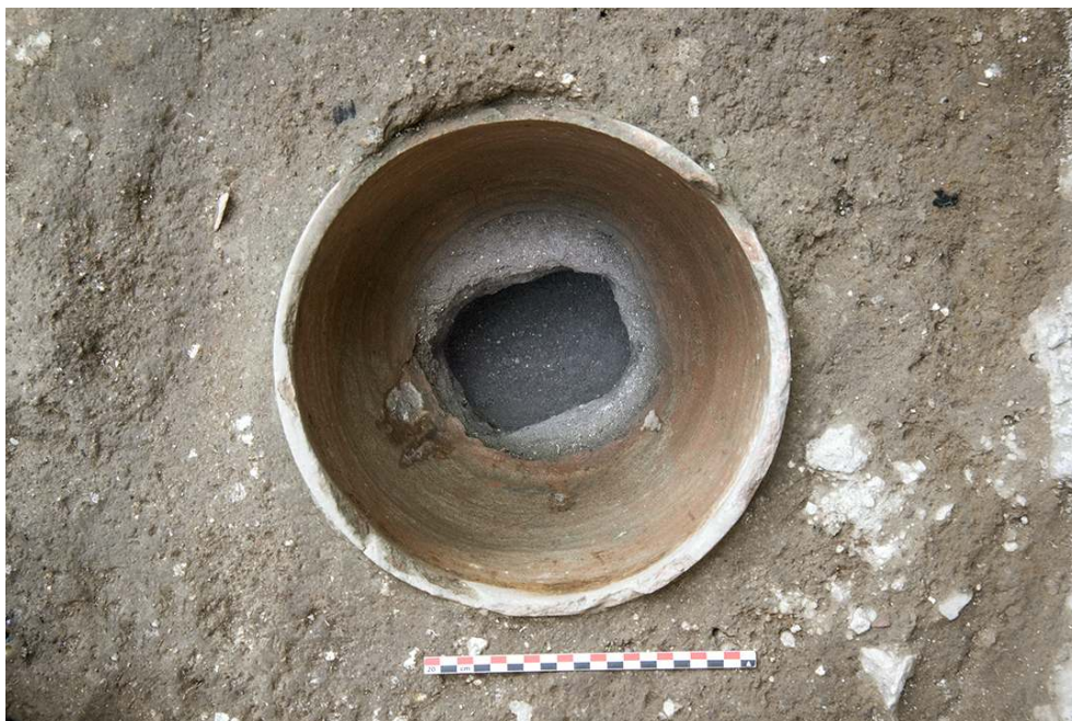
Fig. 4 – DÉTAIL DE L'EMPLACEMENT DE L'AXE DU TOUR DE POTIER

négatif de l'emplacement de l'axe de maintien du tour de potier. La forme de la cavité, quadrangulaire, indique clairement qu'il s'agit d'un tour à axe fixe (fig. 4).