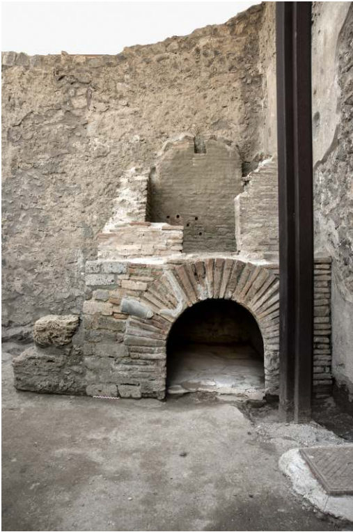
Fig. 5 – Petit four