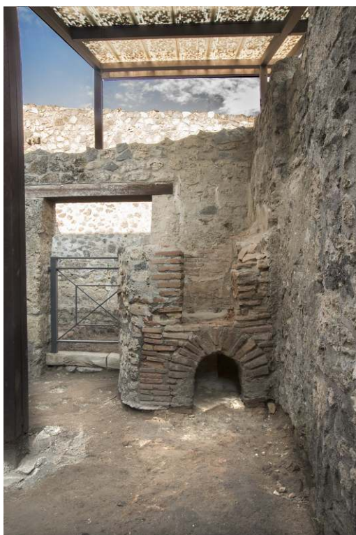
Fig. 6 – Grand four