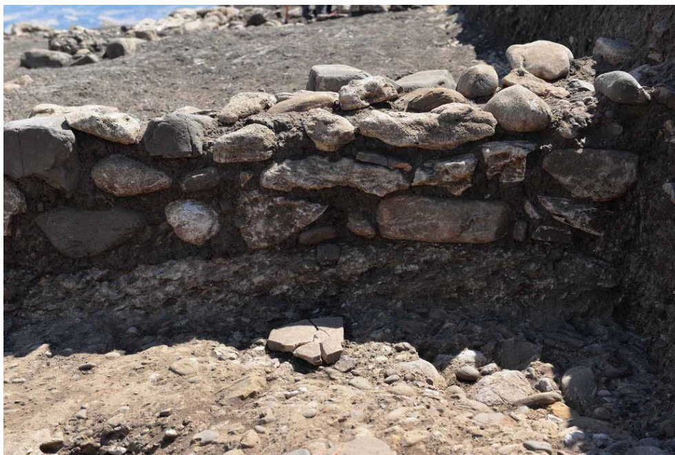
Fig. 2 – Serra del Cedro : maison alpha , pièce 2, mur 163.

55-60 cm, comporte encore trois assises superposées, de moellons de grès et calcaire, avec des éléments en remploi, en particulier un fragment de vasque de louterion ).