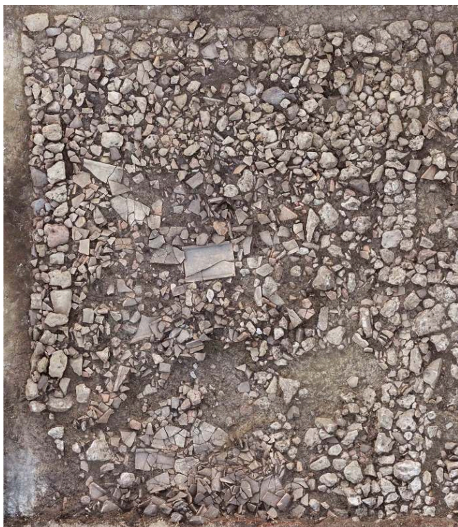
Photogrammétrie T. Terrasse.