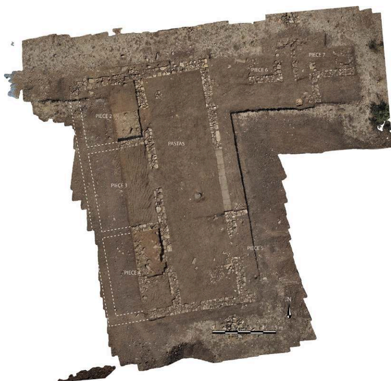
Fig. 1 – Serra del Cedro : la maison alpha , photoplan. Le chapiteau dorique, prélevé en fin de campagne 2016, a été repositionné virtuellement.

rendu malaisé par le fait que les quelques murs (US 184 et 186) qui partent de la fouille 2016-2017 vers la tranchée 1986 sont mal conservés et qu'ils apparaissent détruits et recouverts, au contact de la berme nord (qui a été reculée cette année, sur 5 m de long et 1 m de large), par des blocs informes de conglomérat sédimentaire détritique (« poudingue ») détachés du substrat immédiatement sous-jacent. On peut faire l'hypothèse qu'il s'agit de morceaux de roche extraits par l'engin mécanique qui travaillait à la saignée du gazoduc, et rejetés sur les bords de la tranchée. En ce cas, la situation de cette interface entre les fouilles de 1986 et celles de 2016-2017 est irrémédiablement compromise, au moins en ce point.