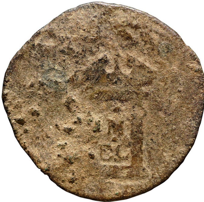
Fig. 1 – Monnaie jubilaire de Clément VIII, frappée en 1600 : la Porta Santa.