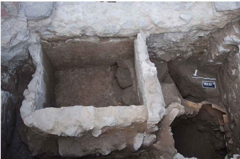
Fig. 2 - Pompéi, boutique VII 4, 27, cuve recoupant un puits.