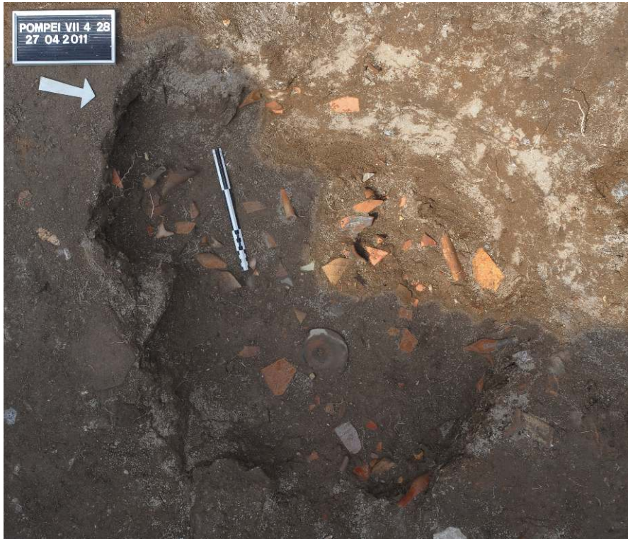
Fig. 5 - Pompéi, boutique VII 4, 28, aspect du comblement d'une fosse remplie d' unguentaria en céramique.