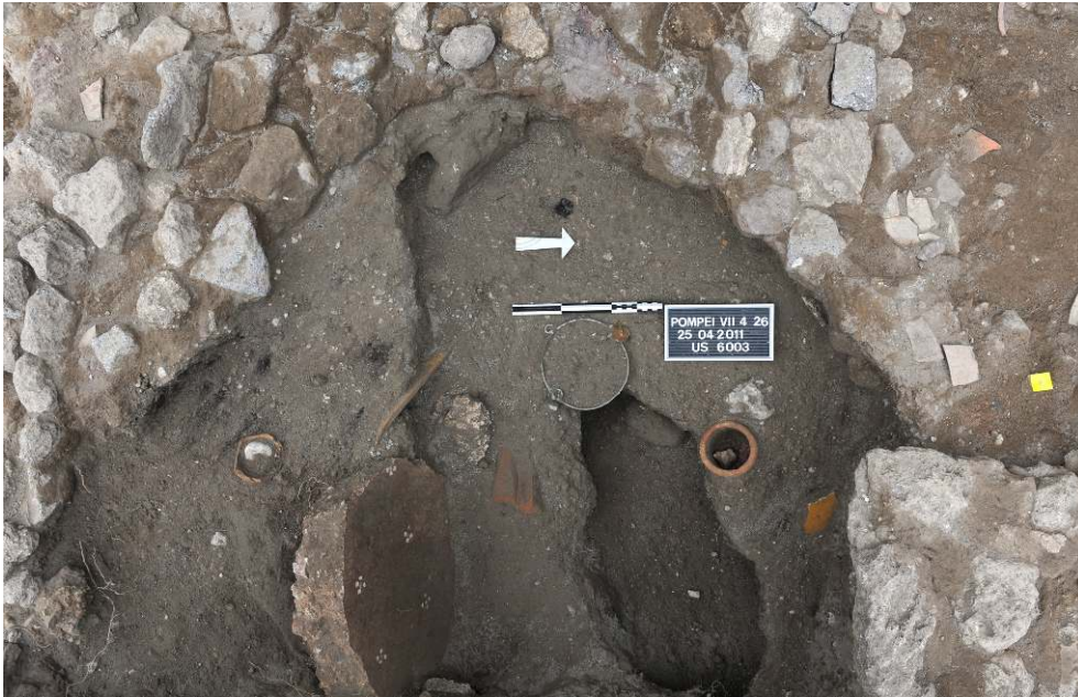
Fig. 3 - Pompéi, boutique VII 4, 26, lapilli comblant la cave.