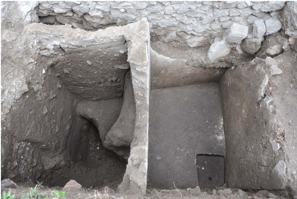
Fig. 6 - Pompéi, boutique VII 4, 28, fosse remplie d' unguentaria (à gauche) recoupée par une cuve (à droite).