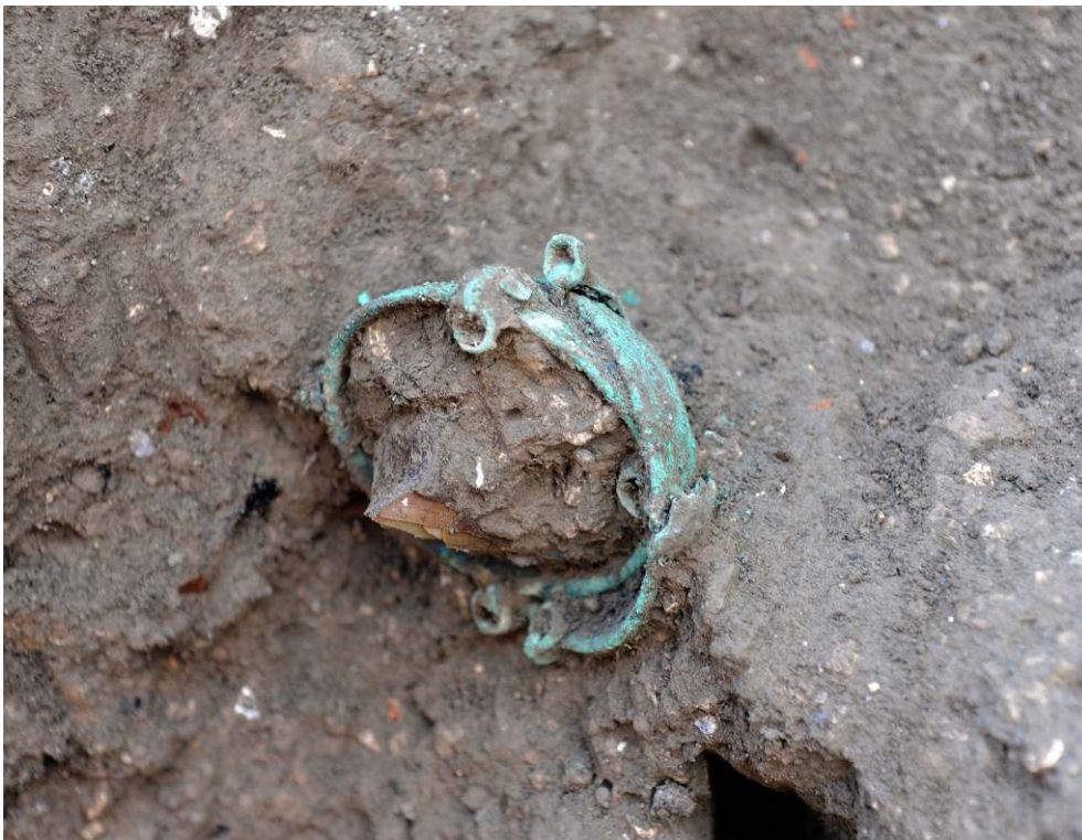
Fig. 4 - Pompéi, boutique VII 4, 26, plateaux de balance dans la couche de lapilli.