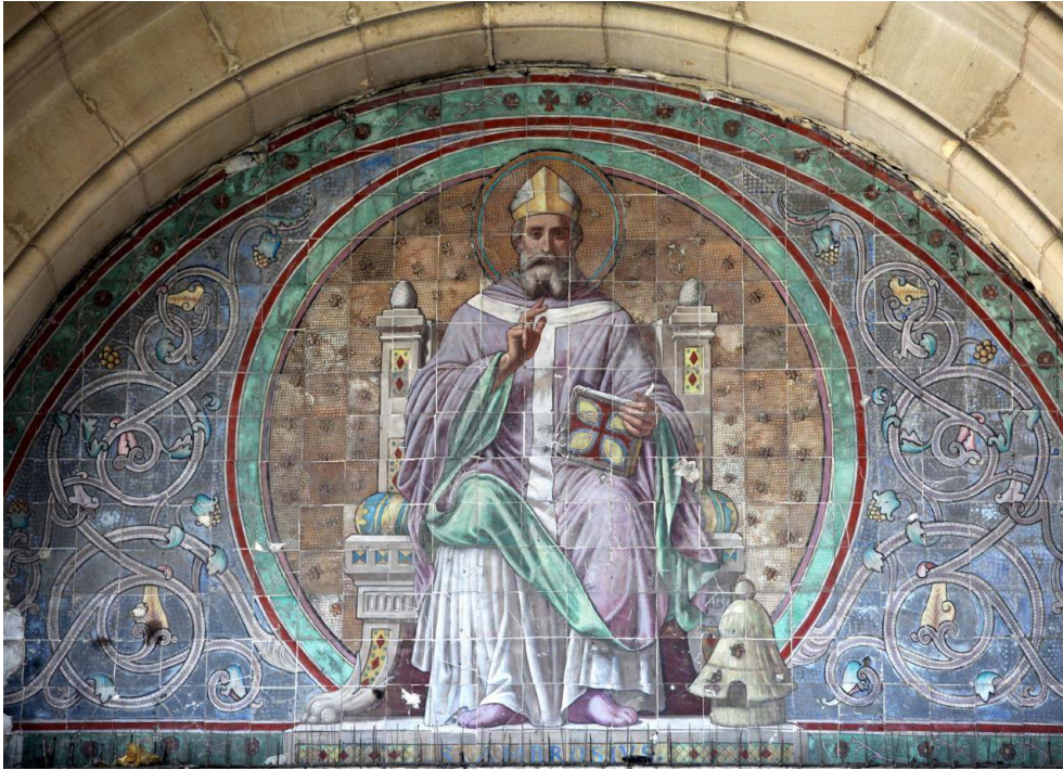
Saint Ambroise , peinture sur lave émaillée exécutée par Guiseppe Devers sur des cartons de Charles Soulacroix en 1866 pour le tympan de la porte centrale du porche de l'église Saint-Ambroise, 11 e arrondissement, Paris.