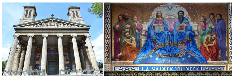
Fig. 1 et Fig. 2

À gauche : Façade de l'église Saint-Vincent-de-Paul, 10 e arrondissement, Paris. À droite : Le détail de la façade : La Trinité , première des peintures exécutées par Jules Jollivet en 1846 et composée de quatre panneaux.