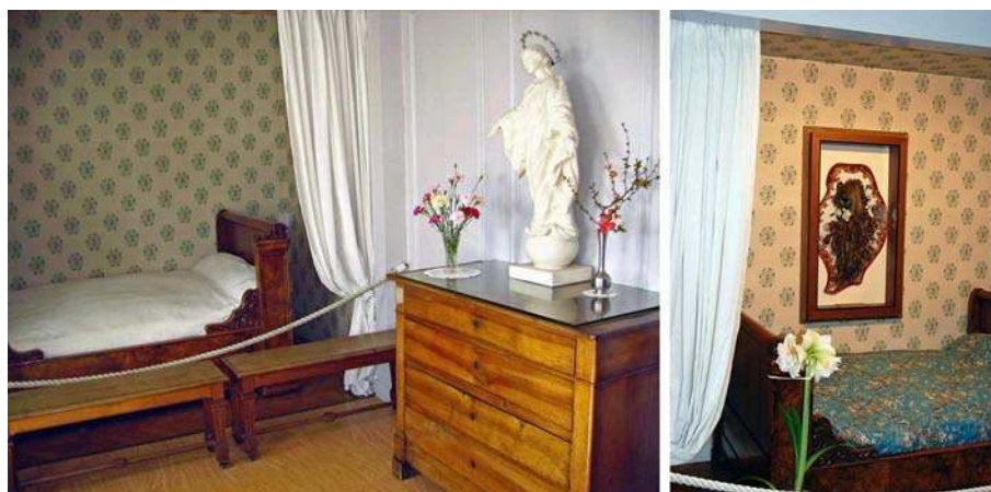
FIGURE 3 (DROITE) :

LA CHAMBRE DE SAINTE THÉRÈSE « RESTITUÉE », À DROITE DU LIT LA « VIERGE AU SOURIRE » LISIEUX, LES BUISSONNETS