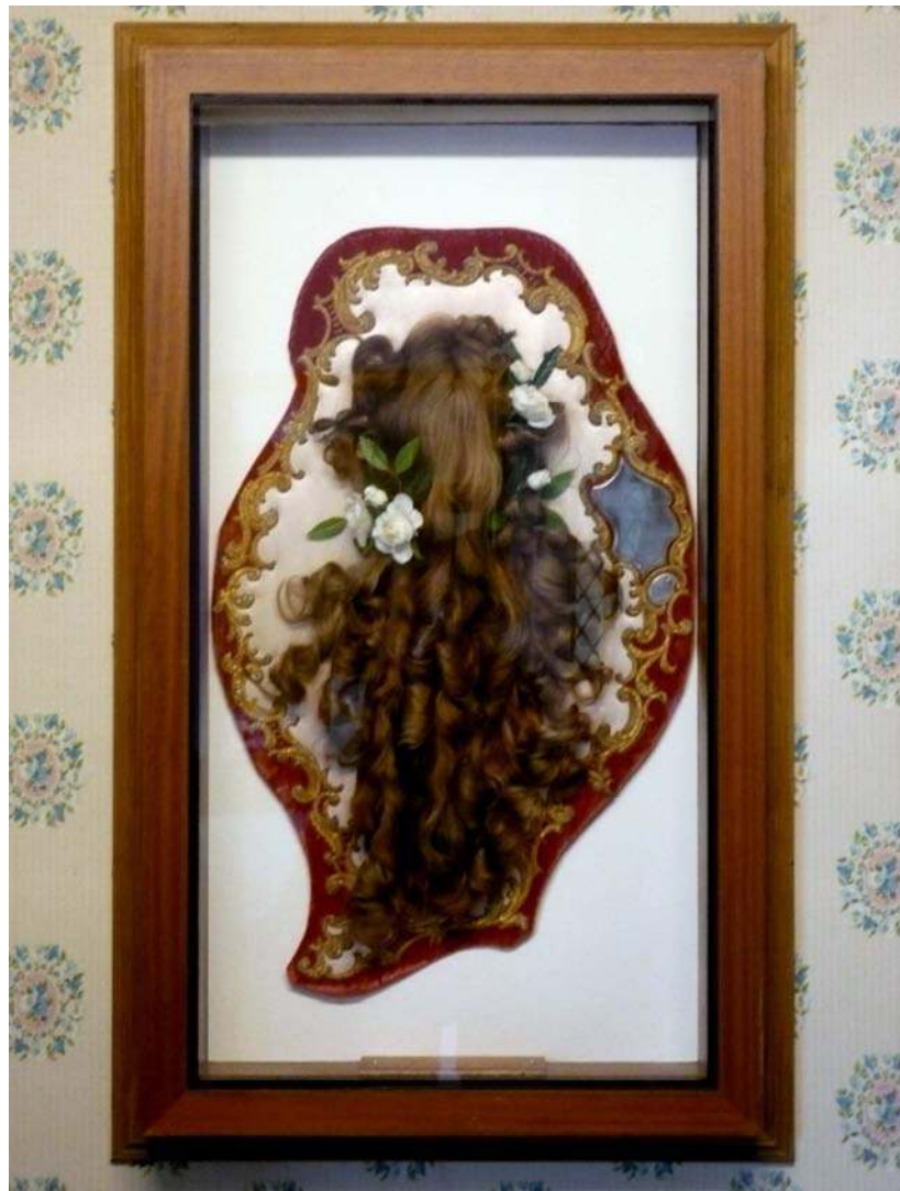
FIGURE 4 : LA RELIQUE CAPILLAIRE DE SAINTE THÉRÈSE LISIEUX, LES BUISSONNETS

Cependant, un miroir près de cheveux peut aussi paraître étrange : il rappelle ici, précisément, l'élément manquant et absent qu'est le visage.